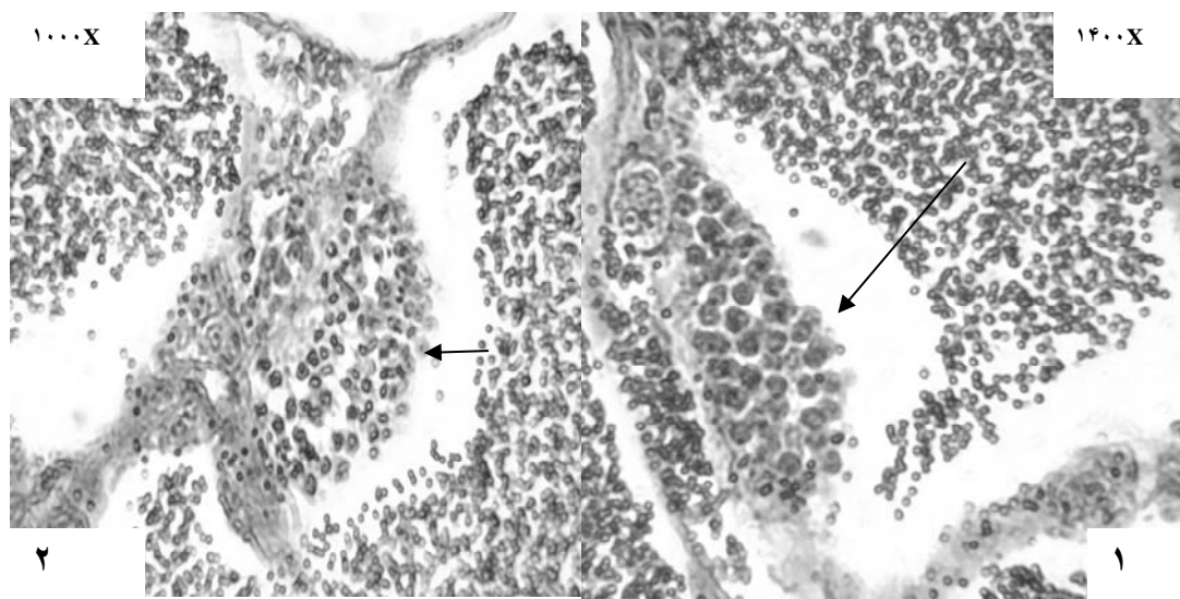
شکل ۱- ادامه روند اسپرماتوژنز و تقسیم سلول‌های اسپرماتوگونی در تیمارهای شاهد، (۱) روز سوم؛ (۲) روز ششم، پیکان بزرگ: سلول‌های اسپرماتوسیت؛ پیکان کوچک: سلول‌های اسپرماتید

به منظور مقایسه تغییرات بافت شناسی و بررسی اثرات مدت زمان تماس با آلاینده‌های مورد نظر در قطعات بیضه، هر کدام از تیمارهای مورد نظر به دو دسته تقسیم شد و دسته اول پس از گذشت ۳ روز، دسته دوم پس از ۶ روز، جهت مطالعات بافت شناسی با میکروسکوپ نوری در محلول بوئن فیکس شدند. پس از انجام مراحل تهیه اسلایدهای بافت‌شناسی، لام‌های تهیه شده با همتوکسیلین و ائوزین رنگ‌آمیزی و با استفاده از میکروسکوپ نوری به بررسی تغییرات هیستوپاتولوژیک پرداخته شد.