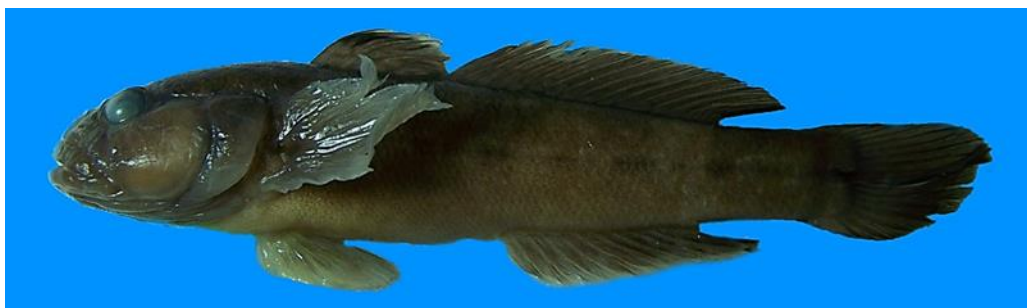
شکل ۱- نمای جانبی گونه گاوماهی ایرانی، Ponticola iranica از رودخانه سفیدرود.