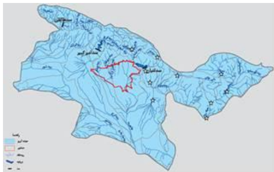
شکل ۱ - نقشه رودخانه‌های استان تهران و موقعیت ایستگاه‌های نمونه برداری (★) در این تحقیق.

می‌گیرد. رود لار، از کوه‌های برف گیر و پرباران کلون بستک، که در شرق و شمال شرقی استان تهران قرار دارد، سرچشمه می‌گیرد. رودخانه جاجرود، یکی از مهم‌ترین رودخانه‌های استان تهران است که از کوه‌های کلون بستک، در بلندی‌های خرسنگ کوه، سرچشمه می‌گیرد (Afshin, 1999). در این مطالعه گاماروس-های رودخانه‌های شرق استان تهران از نظر تنوع ژنتیکی مورد بررسی قرار گیرد.