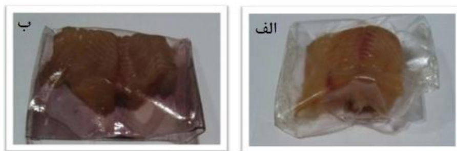
شکل ۲- تغییر رنگ فیلم‌های حاوی عصاره کلم در بسته‌بندی فیله‌های ماهی قزل‌آلا در ابتدا (الف) و انتهای دوره نگهداری (ب).

حروف a و b در بالای اعداد در یک ستون نشان‌دهنده وجود اختلاف معنی‌دار بین فیلم شاهد و فیلم حاوی عصاره است ( p < 0.05 ).