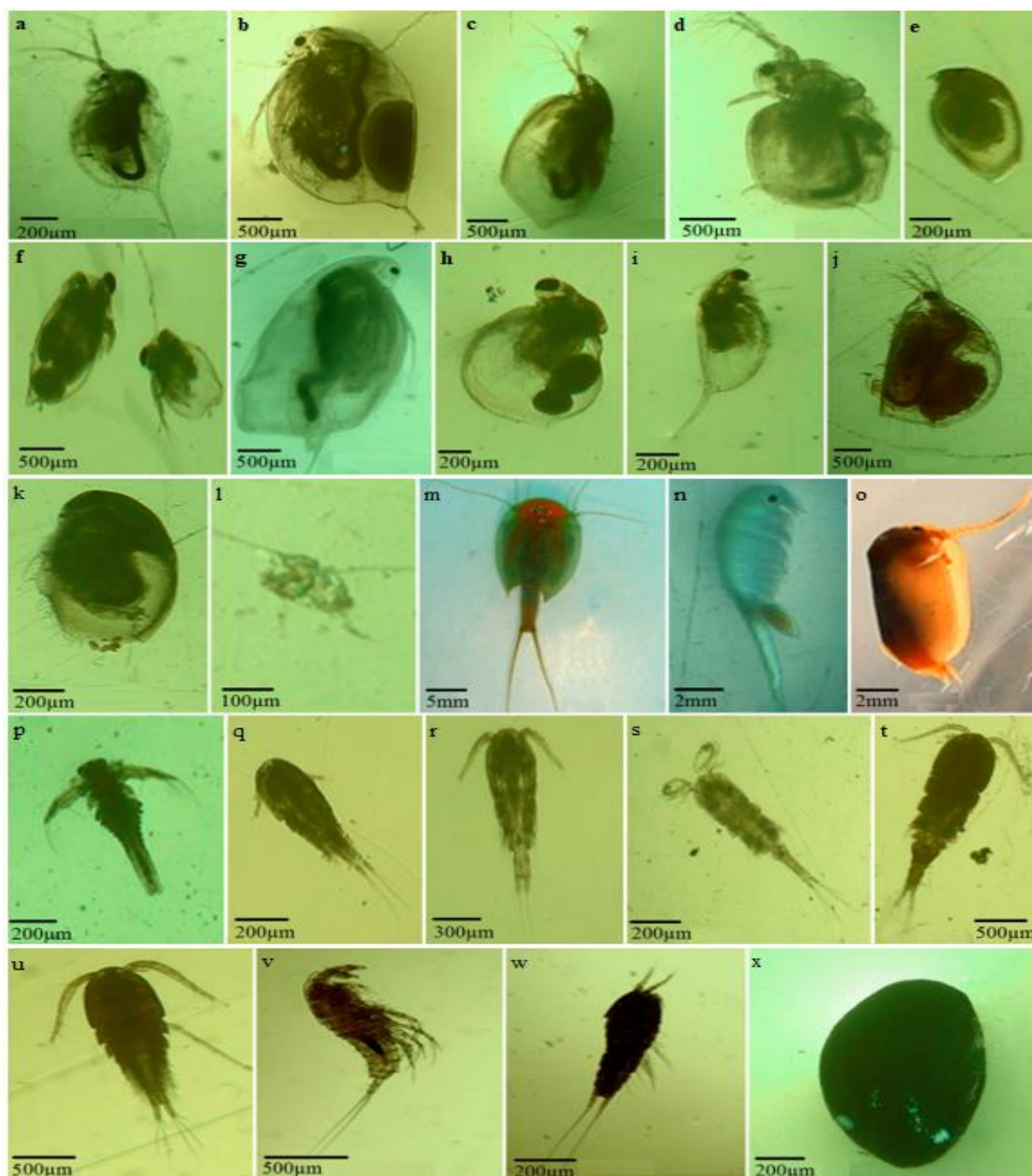
شکل ۲- رده Branchiopoda گونه های: (d) Moina salinarum ، (k) Macrothrix hirsuticonis ، (b) Daphnia magna ، (a) Daphnia pulex ، (g) Simocephalus exspinosus ، (c) Simocephalus vetulus ، (l) Leptodora kindtii ، (j) Scapholeberis aurita ، (e) Alona rectangul ، (i) Daphnia similis ، (o) Leptestheria compleximanus ، (f) Ceriodaphnia reticulata ، (h) Ceriodaphnia dubia رده Hexanauplia گونه های: (m) Triops cancriformis ، (p) Artemia parthenogenetica ، (n) Branchinecta orientalis ، (s) Diacyclops bicuspidatus ، (t) Diacyclops bicuspidatus ، (u) Acanthocyclops robustus ، (q) bisetosus ، (v) Cyclops sp. ، (x) Cyclops sp.