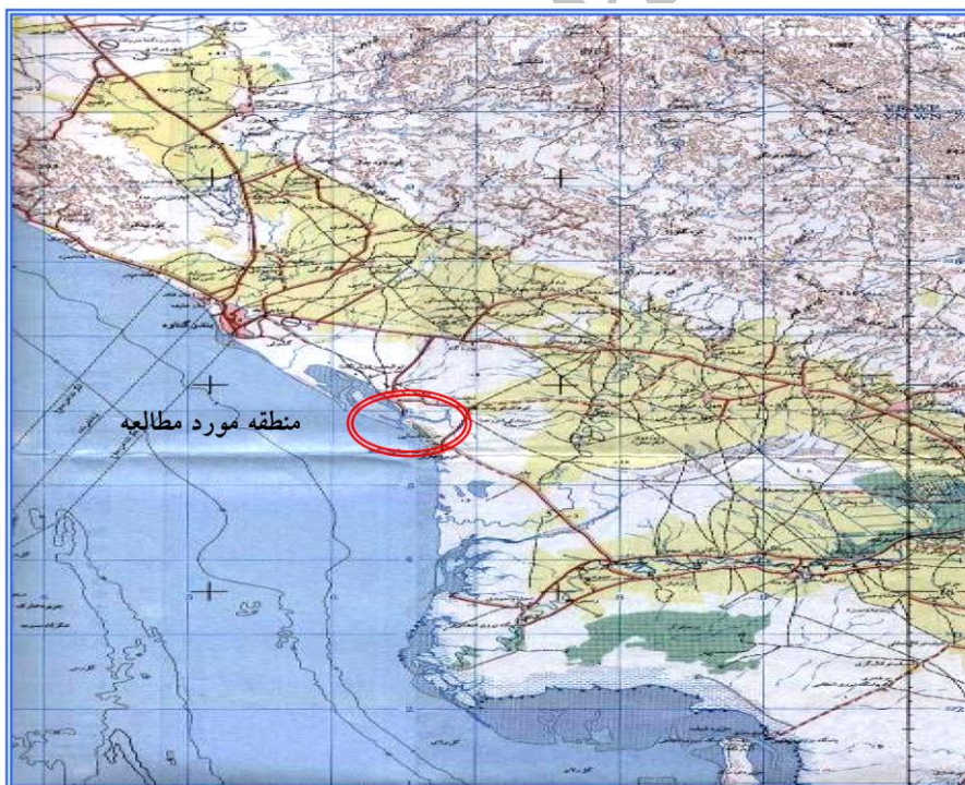
شکل 1- منطقه مورد مطالعه (خور ریگ در ساحل غربی استان بوشهر)

شهر به آن محسوب می‌شود. فاصله دریایی گناوه تا بندر ریگ حدود 18 کیلومتر می‌باشد. به همین ترتیب دهانه خور ریگ تا خور جزیره از طریق دریا 2/32 کیلومتر فاصله دارد. از لحاظ جغرافیای طبیعی، بندر ریگ هم‌چون دیگر بنادر استان بوشهر، در مجاورت دریا و در یکی از دشت‌های ساحلی توسعه‌یافته است. این خور از سه بخش رودخانه‌ای، مرداب و دریایی تشکیل شده است. بخش مرداب آن از یک سد ماسه‌ای و مرداب پشت آن تشکیل شده است. سد ماسه‌ای و مرداب خور ریگ به ترتیب 4100 و 4616 متر طول دارند که هر دو در راستای شمال‌غرب-جنوب‌شرق به موازات ساحل کشیده شده‌اند. مرداب خور از شمال‌غرب به خور آرش و از جنوب‌شرق به بخش‌های رودخانه‌ای و دریایی محدود می‌شود. بخش دریایی خور با طول 1200 تا 1400 متر به