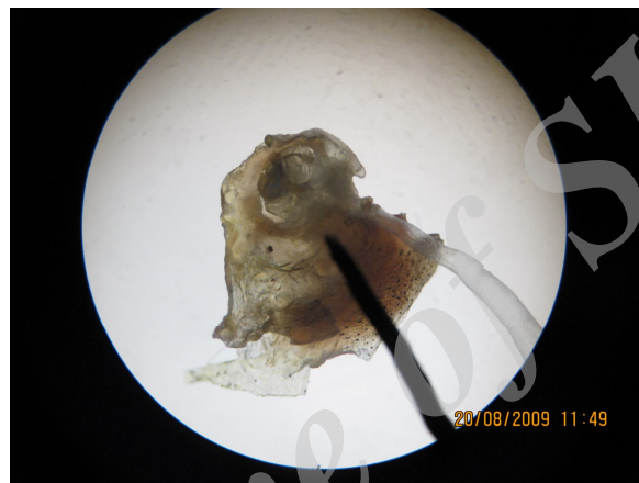
شکل ۲- انگل لرنه آ جدا شده از پوست (X 4 ).

به لرنه آ داشته و ۷۱/۶۴ درصد بقیه بدون آلودگی به این انگل بودند.