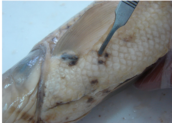
شکل ۱- آثار به جا مانده از نفوذ انگل لرنه آ در پوست.