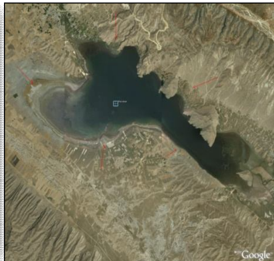
شکل ۱- موقعیت استان فارس، شهرستان کازرون و تصویر ماهواره‌ای دریاچه/ تالاب پریشان به هنگام پربابی، ۱۳۸۰.