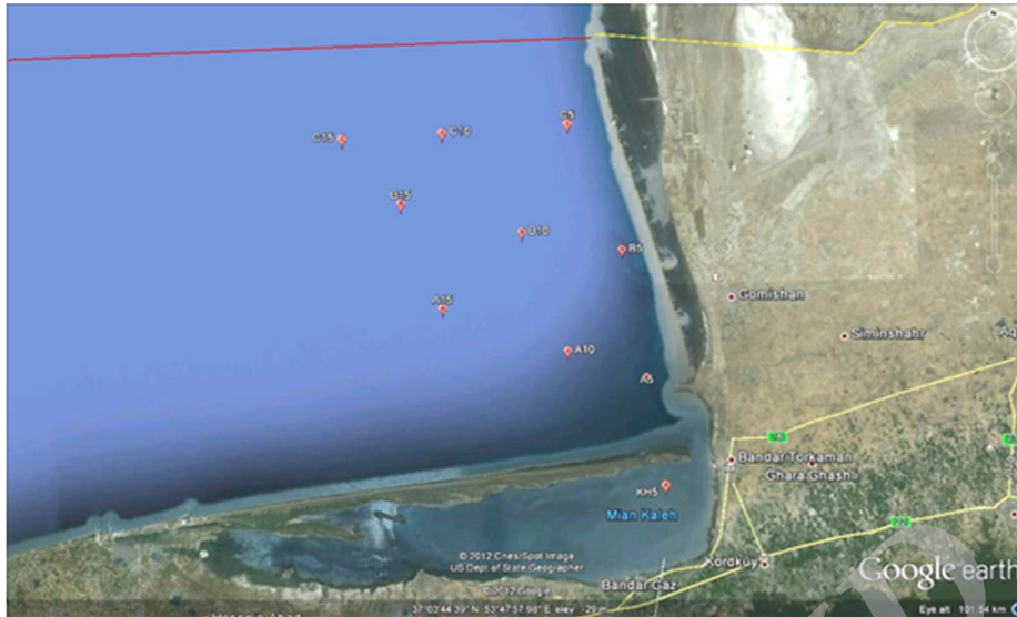
شکل ۱: نقشه مکان ایستگاه‌های نمونه‌برداری در ساحل استان گلستان و خلیج گرگان

استفاده شد و در نهایت با استفاده از فرمول زیر مقادیر کمی کلروفیل a در هر ایستگاه بدست آمد.