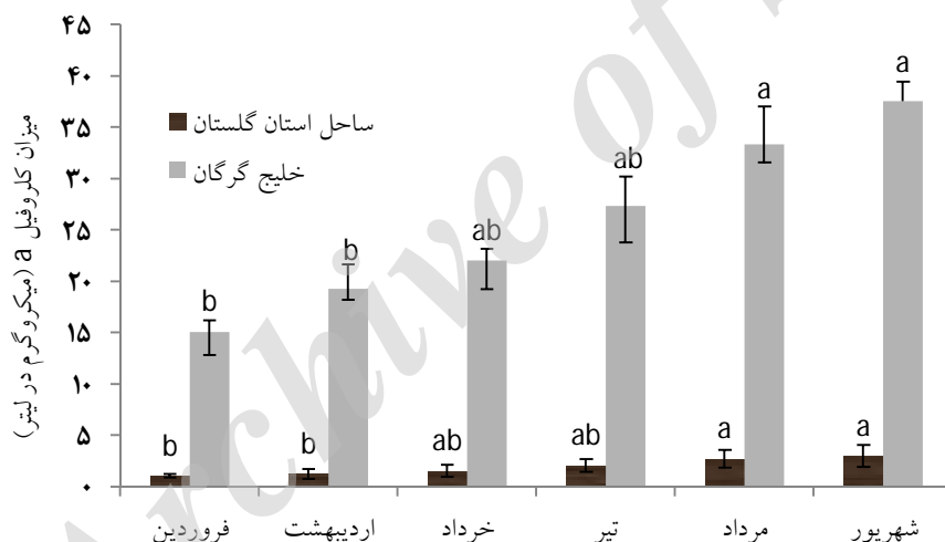
شکل ۲- میانگین میزان ماهانه کلروفیل a در آب سواحل استان گلستان و خلیج گرگان (نمادهای غیر همسان نشان‌دهنده اختلاف معنی‌دار بین ماه‌های مختلف می‌باشند)