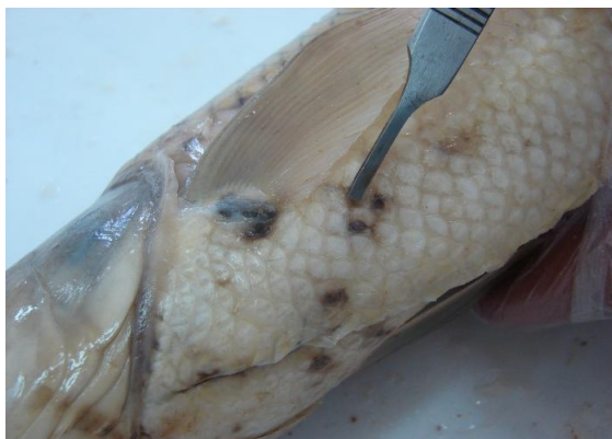
شکل ۱- آثار بجا مانده از نفوذ انگل لرنه‌آ در پوست ماهی کپور معمولی