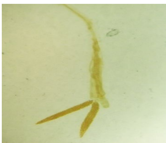
شکل ۲- انگل لرنه‌آ جدا شده از پوست ماهی کپور معمولی (X20)

این انگل بودند. بیش‌ترین انگل بر روی پوست ماهی‌ها با فراوانی ۶۸/۱ درصد و کم‌ترین در چشم آن‌ها با فراوانی ۰/۵ درصد مشاهده گردید.