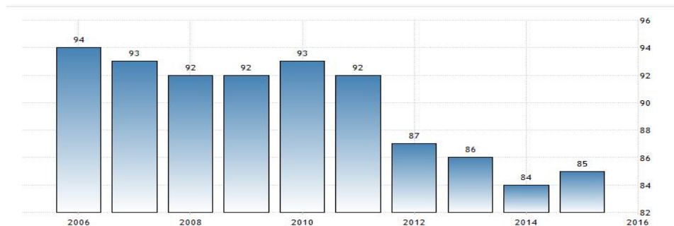
نمودار (۱): شاخص‌های فساد مالی در اقتصاد سنگاپور از ۲۰۰۶ تا ۲۰۱۶

سنگاپور پس از ۶۰ سال مبارزه بی‌وقفه توانسته فساد را در این کشور به حداقل برساند. به گزارش سازمان شفافیت بین‌الملل، این کشور بیش از یک دهه است که در بین پاک‌ترین دولت‌های دنیا قرار گرفته است. امروزه فساد در سنگاپور به‌عنوان «واقعیتی» در زندگی و نه «روشی» برای زندگی وجود دارد و بیشتر در سطح فردی مشاهده می‌شود تا به‌صورت سیستمی و سازمان‌یافته. در سال ۲۰۱۰ سنگاپور همراه با دانمارک و نیوزیلند جزو کم‌فسادترین ملت‌های دنیا قرار گرفت. همچنین موسسه مشاوره ریسک سیاسی و اقتصاد (PERC) که مقر آن در هنگ‌کنگ هست، در ده سال گذشته سنگاپور را در رتبه‌بندی خود در جایگاه نخست، کشوری با کمترین فساد، قرار داده است (Hin, 2015: 27).