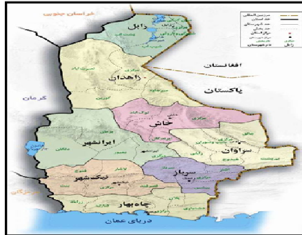
نقشه موقعیت مرزی پاکستان و ایران