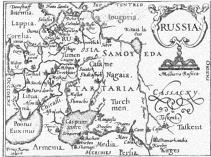
شکل ۱: نقشه جنکینسون از روسیه و تاتارستان (مشکوربان، ۱۳۹۲: ۱۶)