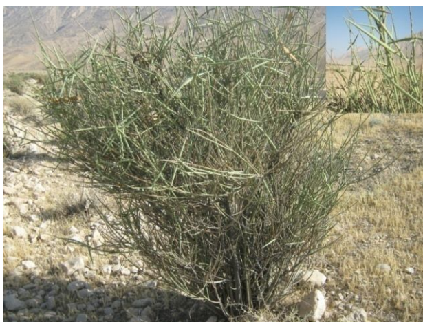
شکل ۲- گونه گیشدر ( Periploca aphylla )