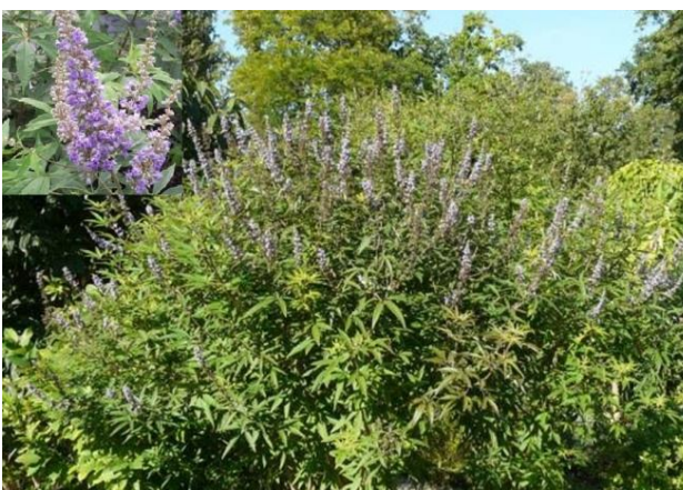
شکل ۳- گونه بنگلا ( Vitex agnus-castus )