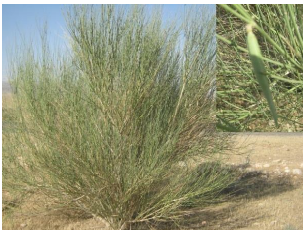
شکل ۱- گونه پیچیلوک ( Leptadenia pyrotechnica )