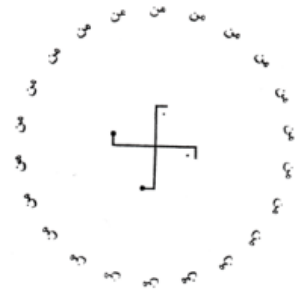
(صفارزاده، ۱۳۶۸: ۶۱)