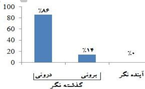
شکل ۱: نمودار نظم