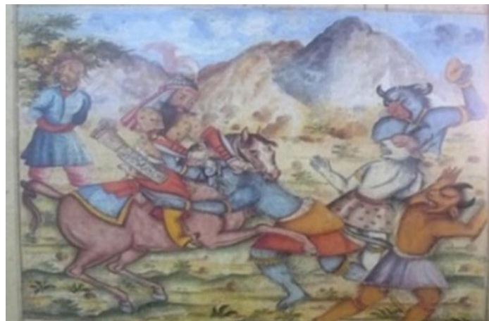
تصویر ۶: نگارهٔ نبرد رستم با ارژنگ دیو؛ نسخهٔ قرن ۱۱ هـ.ق.، کتابخانهٔ ملی ایران (بهادری، ۱۳۷۶: ۲۳۶)

خدایان دریاها و ایزدان توفان و صاعقه، پری دریایی و... شده‌است» (رستگار فسایی، ۱۳۸۸: ۱۲۴). در اساطیر ایرانی، همهٔ فره‌مندان به‌سادگی از آب می‌گذرند و گذر از آب، نمادی اساسی از حمایت یزدانی قهرمانان ایرانی است. در خان ششم، رستم برای نجات کیکاوس از بند دیو سپید، از رودی می‌گذرد (ر.ک؛ فردوسی، ۱۳۹۰: ۱۴۳). در این خان، رستم با وجود فرّ و ببر بیان، ارژنگ دیو را شکست می‌دهد و سرانجام، به خان هفتم راه می‌یابد. در نگارهٔ زیر (تصویر ۶)، نقاش بسته‌شدن اولاد به درخت را در پشت رستم، یعنی دور از میدان مبارزه به تصویر کشیده‌است که گویای وفاداری تصویر به متن اصلی است. علاوه بر کوه‌ها که نشان‌دهندهٔ گذر رستم در مازندران است، دیوان را موجوداتی با شکل‌های غیرانسانی، عجیب و غریب نشان می‌دهد که رستم وقتی بر ارژنگ پیروز می‌شود، بقیهٔ دیوان می‌گریزند که در تصویر زیر به خوبی به نمایش گذاشته شده‌است. دیوان به رنگ‌های آبی تیره، سفید و نارنجی تصویر شده‌اند و دو دیو بزرگ به رنگ آبی، بیانگر قدرت پوچ و بی‌ثمر و نیز روحیهٔ ناامیدی و یاسی است که آن‌ها در برابر رستم دچار شده‌اند. رنگ سفید به دو معناست: یکی نماد پاکی و معصومیت و دیگری ترکیبی از تمام طیف رنگ‌های سیاه، قرمز، آبی و زرد است (ر.ک؛ لوشر، ۱۳۸۸: ۴۷). در این نگاره، دیو سفید نمایانگر آن است که او تمام پلیدی‌ها، زشتی‌ها، شهوت‌ها و همهٔ ویژگی‌های زشت انسانی را دارد و کوه‌ها به رنگ خاکستری و قهوه‌ای هستند که نماد استواری و استحکام آن‌هاست (ر.ک؛ همان: ۷۵).