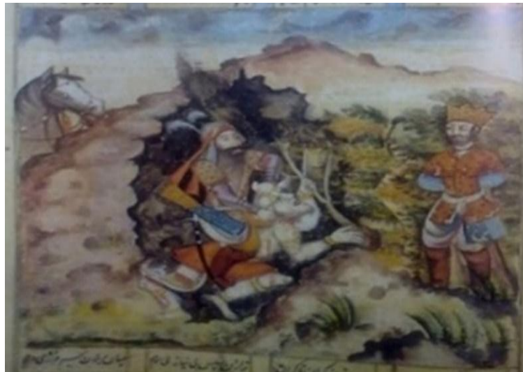
تصویر ۷: نگاره نبرد رستم با دیو سپید؛ نسخه قرن ۱۱ هـ.ق؛ کتابخانه ملی ایران (حسنی، ۱۳۸۵: ۱۵۱)

اعراب جاهلی یکی از زیباروترین اسیران جنگی را در برابر بُت قبیله خود و مالیدن خون او بر سر و چهره برای استمرار پیروزی در نبرد، نشان گذاشتن با خون قربانی جانور (گاو و گوسفند) بر پیشانی شخص یا بخشی از جایی که قربانی برای او صورت گرفته است (برای مطالعه بیشتر، ر.ک؛ مصطفوی، ۱۳۶۹: ۸۵). سرانجام، رستم کیکاوس را نجات می‌دهد و از این آزمون سربلند بیرون می‌آید. در نگاره زیر (تصویر ۷)، نقاش به خوبی تلاش کرده است تا خواننده را با متن روایت به کمک تصویر همراه کند. در این نگاره، پادشاه با لباس قهوه‌ای که نماد قدرت، استحکام و استواری است، نشان داده شده است. همچنین، از قسمت سیاهی غار که نماد شر، بدبختی و مرگ است، نجات یافته، به قسمت سرسبز و پُر از درخت که با رنگ سبز نشان داده شده، قرار گرفته است که این رنگ نشان‌دهنده حیات و زندگی دوباره به پادشاه است. دیو به رنگ سفید نشان داده شده که در تحلیل تصویر ۶ به آن اشاره شده است. به علاوه، در این نگاره، وجود کوه‌ها نمادی از مازندران به شمار می‌روند. غار که به رنگ سیاه نشان داده شده، مسکن دیو سپید است و وجود لکه خون به رنگ قرمز در پهلوی آن و نیز لباس جنگی رستم (= بیر بیان) و دیگر سلاح‌های او به زیبایی به نمایش گذاشته شده‌اند و رابطه بین تصویر و متن اصلی را برای مخاطب معنادار کرده است.