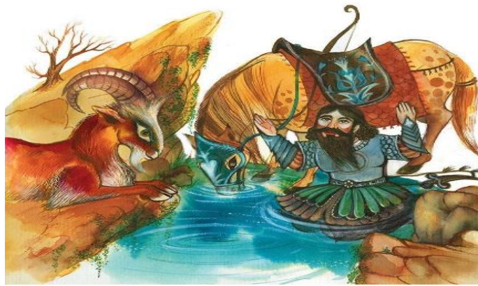
تصویر ۲: نگاره ۲ رستم در خان دوم با رخس و میش (بهادری، ۱۳۷۶: ۲۲۳)

توسل به خداوند و پیروزی در مرحله‌ای دشوار به رستم داده می‌شود. به همین دلیل، در نگاره ۲ زیر (تصویر ۲) به رنگ قهوه‌ای، زرشکی و کرمی به تصویر کشیده شده‌است و نشان‌دهنده استواری و مقاومت است. قوچ، حیوانی وابسته به زایش و بارورکننده، ستبر، فریه و مناسب قربانی در بسیاری از ادیان است (ر.ک؛ مصطفوی، ۱۳۶۹: ۸۵) و به عنوان فرّ نمادی از لطف الهی در داستان ذبح حضرت اسماعیل (ع) و نیز در داستان اردشیر نمود یافته‌است. در نگاره ۲ زیر، درخت خشک و بی‌برگ و نیز رنگ کرم، نشان‌دهنده بیابان است و نقاش به متن اصلی خان دوم در شاهنامه وفادار بوده‌است و به‌خوبی آن را به نمایش گذاشته‌است. در این نگاره، رستم با لباسی آراسته و به رنگ سبز و آبی، رخس با افسار و زین به رنگ آبی و نیز چشمه به رنگ آبی به تصویر کشیده شده که «رنگ آبی و سبز نماد آرامش‌بخشی و زندگی‌بخش است» (لوشر، ۱۳۸۸: ۳۹). در واقع، نقاش در تلاش بوده‌است تا نشان دهد که رستم پس از نیایش خداوند و رسیدن به چشمه آب، دوباره به زندگی و آرامش رسیده‌است که متن اصلی داستان را در ذهن خواننده متبادر می‌کند.