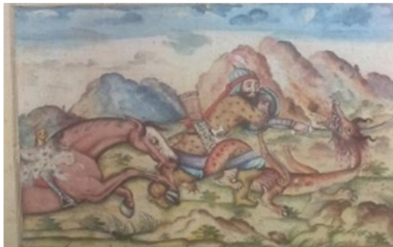
تصویر ۳: نگاره رستم و نبرد او با اژدها؛ نسخه قرن ۱۱ هـ. ق.؛ کتابخانه ملی ایران (حسینی، ۱۳۸۵:

در خان سوم در بیشه‌ای در بیابانی خشک با اژدهایی پتیاره روبه‌رو می‌شود که در نگاره زیر (تصویر ۳)، دشت خشک و کوه‌های بی‌درخت گویای این مطلب است. در این نگاره، نقش رخس در کمک و یاری رساندن به رستم، ضربه زدن رستم به سر اژدها و بریدن آن، پوشش به شکل خالدار رستم (پلنگینه‌پوش / ببر بیان) به خوبی تصویر شده است و وفادار به متن اصلی خان سوم شاهنامه است و داستان این خان را با تصویر برای خواننده روایت می‌کند. کلاه خود رستم و آسمان به رنگ آبی است که مظهر آرامش، امید و زندگی است (ر.ک؛ لوشر، ۱۳۸۸: ۳۸). در واقع، نقاش با هماهنگی رنگ در تلاش بوده است تا امید به زندگی و پیروزی رستم را در ذهن مخاطب تصویر کند. پیراهن رستم به رنگ کرم است که نمایانگر پایداری و ایستادگی در برابر اژدهای غول‌پیکر است. رخس به رنگ قهوه‌ای که نماد پایداری است، دیده می‌شود و قسمت پیشانی و سر او با رنگ سفید کشیده شده که نشان‌دهنده ذهنیت و درون پاک و معصوم اوست.