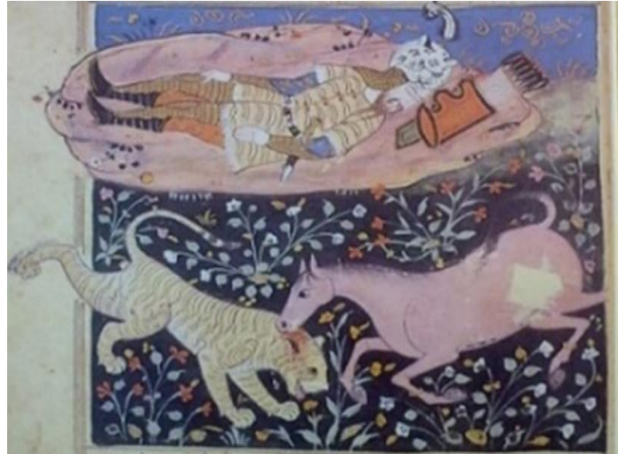
تصویر ۱: نگاره خان اول و نبرد رخس با شیر؛ نسخه قرن ۱۰ هـ.ق.؛ کتابخانه مجلس (حسینی، ۱۳۸۵: ۱۴۳)