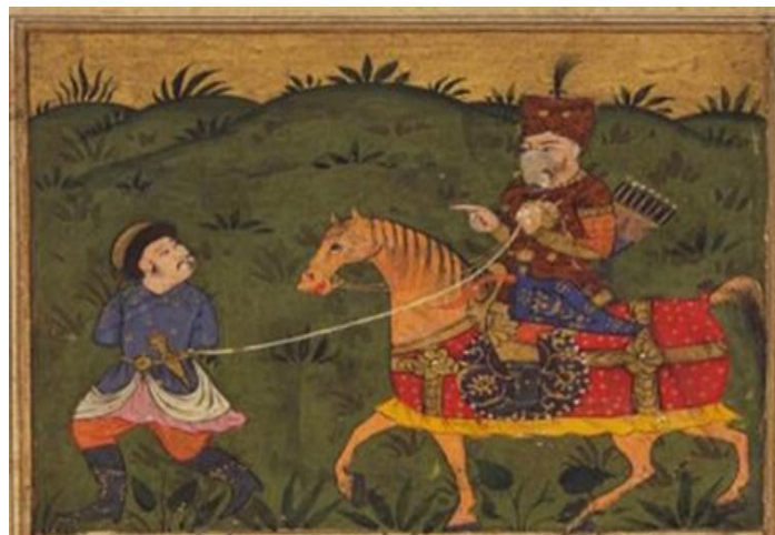
تصویر ۵: نگاره رستم و اولاد دیو (بهادری، ۱۳۷۶: ۲۳۳)

روبه‌رو می‌شود. پس وجود رنگ سبز، بیانگر همخوانی تصویر با متن اصلی است و نقاش با نشان دادن این رنگ، سعی کرده است تا پیروزی رستم بر اولاد را به‌خوبی به تصویر بکشد.