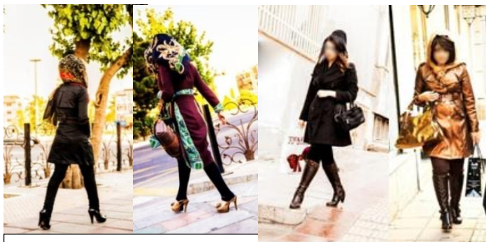
شکل ۵. عکاسی مد در خیابان

تنوع و تحول در شرایط زنان در تاریخ ایران رخ داده است ۱ [۷، ص ۲۹] و همین تزلزل‌ها به نامتعادل بودن در شرایط امروزی نگاه به زن و نمایش بدن وی در چگونگی عکاسی مد مؤثر است که در ادامه بررسی خواهد شد.