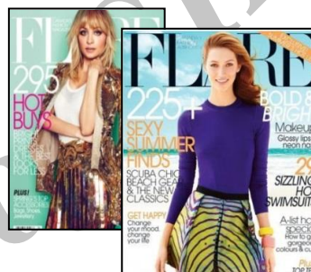
شکل ۲. مجلات تبلیغ پوشاک