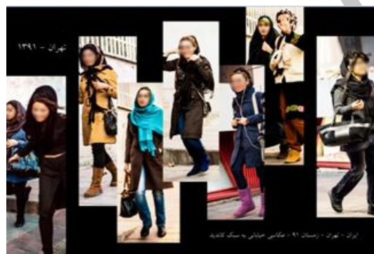
شکل ۶. سوژه‌هایی که متوجه حضور عکاس شده‌اند و به اشکال متفاوت مخالفت خودشان را ابراز کردند.

نمایش زن بر مبنای موازین مذهبی هر گوشه از جهان شکل ویژه‌ای از محدودیت‌ها را به دنبال خواهد داشت. اما این اعتقادات در کنار عادات فرهنگی و عرف جامعه است که شکل تازه‌تری از نحوه پوشش را برای بانوان به ارمغان می‌آورد. مجموعه‌ای تفکیک‌ناپذیر از مذهب، فرهنگ رشد یافته یا نیافته، و تابوهایی که از زمان نامعلومی نشئت می‌گیرند. این مجموعه به هر شکلی که باشد فقط از نظر دیدگاه‌های جنسیتی توجیه‌پذیرند؛ مثلاً، زن در ایران باستان موجود گرانبه‌ای بود که هرگز موضوعات اروتیک به وی نسبت داده نمی‌شد، چنان‌که حتی در