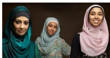
شکل ۱۶. تبلیغات شال و روسری بر مبنای مد عفاف

http://www.smh.com.au/lifestyle/fashion/fabric-interwoven-with-faith-20120427-1xpg8.html