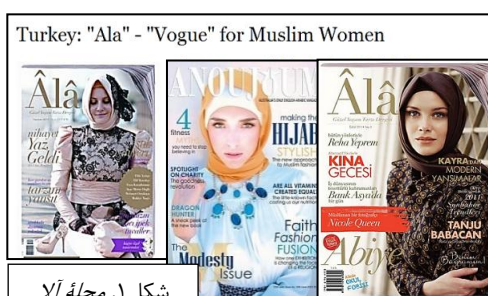
شکل ۱. مجله آلا

منظور از این صراحت، درواقع تمرکز بیشترین توجه به نمایش پوشاک است نه به مدل؛ پس چنان‌که در شکل ۲ مشاهده می‌کنید، فقط لباس این مانکن‌ها با پوشش اسلامی مغایرت دارد و در صورت پوشیده‌شدن، دیگر این تصاویر برای مجلات اسلامی مشکلی نخواهند داشت و حتی در مقایسه با تصاویر مجلات مد ایران از حرکات محدودتر و ساده‌تری استفاده کرده‌اند؛ ۱ به این دلیل که در عکاسی از مد لباس، مدل‌ها فاقد خودنمایی یا حس اروتیک‌اند و حرکت و چرخش آن‌ها فقط برای نمایش بهتر لباس است نه برای نمایش اندامشان؛ پس این تصاویر- در صورت حفظ حجاب- مشکلی ندارند.