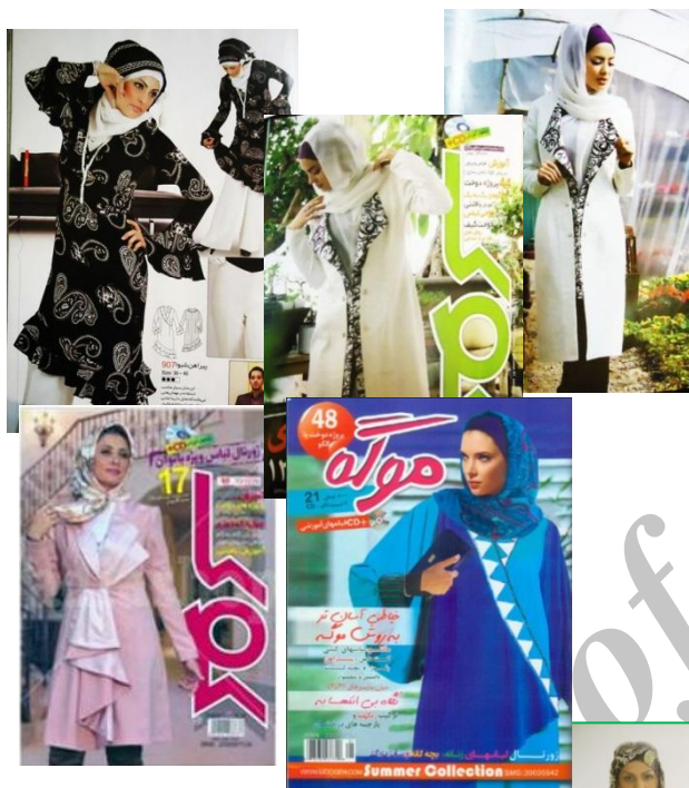
شکل ۱۲. عکاسی مد در ایران اسلامی