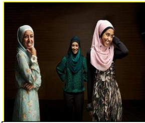
شکل ۱۱. عکاسی مد برای مسلمانان استرالیا (فاقد حس اروتیک)