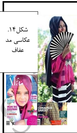
شکل ۱۴. عکاسی مد عفاف

در این وضعیت، ممنوعیت‌ها، و محدودیت‌ها برخی راه سازگاری با تحریم‌های عکاسی مد را به خوبی دریافته‌اند که چنانچه عکس‌های مد در خدمت ترویج پوشش اسلامی مورد قبول مسئولان دولتی باشند، کمی دست عکاس بازتر می‌شود؛ مثلاً اگر به طرح جلد مجلات مختلف در برخی شماره‌ها دقت کنیم (در محدوده عکاسی جلد)، درمی‌یابیم که این عکس‌ها زنان را در حالتی بسیار آزادتر از مجلات مد و پوشاک نمایش می‌دهند (و فقط از نظر لباس بسیار پوشیده هستند و تبلیغ و ترویجی برای این نوع پوشش بین جوانان صورت می‌دهند). یا بسته‌های آموزشی نحوه بستن اسلامی شال و روسری، که در سرتاسر ایران به وفور و از طرف شرکت‌های مختلف عرضه می‌شود، زن‌ها را اندکی به صورت اروتیک و با آرایشی شدید بر چهره نمایش می‌دهند، اما تا مدت زمانی کوتاه یا بلند مخالفتی با تصاویر عکاسی شده روی جلد آن‌ها نمی‌شود، چون به‌هرحال هدف اصلی‌شان ترویج پوشش اسلامی است (شکل‌های ۹ و ۱۵). حال آنکه در کشورهای دیگر همین نوع تصاویر نیز با رعایت اصول عکاس مد عفاف تهیه می‌شوند (شکل ۱۶).