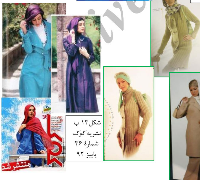
شکل ۱۳ ب نشریه کوک شماره ۳۶ پاییز ۹۲