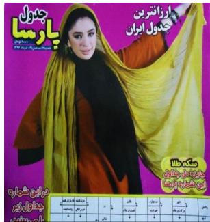
شکل ۱۰. عکاسی مد اروتیکی پوشیده در حجاب