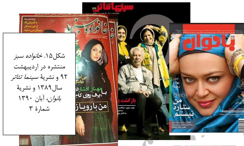
شکل ۱۵. خانواده سبز منتشره در اردیبهشت ۹۲ و نشریه سینما تئاتر سال ۱۳۸۹ و نشریه بانوان، آبان ۱۳۹۰ شماره ۳