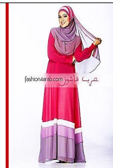
شکل ۴. عکاسی مد عفاف