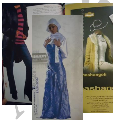
شکل ۳. نشریه پوشاک ایران (مسدودشده)