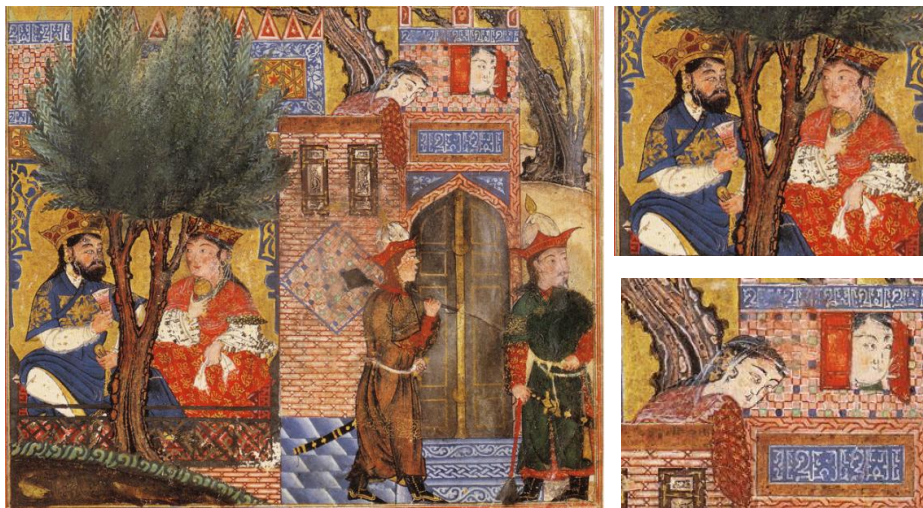
شکل ۱. انوشیروان در خانه مهیود

داستان از این قرار است: انوشیروان، پادشاه نامدار ایرانی، وزیری حکیم به نام مهیود داشته که در محضر وی صاحب نفوذ و محرم اسرار بوده. این امر باعث حسادت بسیاری از جمله زروان شد. مهیود به عنوان امین پادشاه وظیفه داشت هر روز برای پادشاه ظرفی از بهترین غذاها تهیه کند و توسط دو پسرش برای وی بفرستد. زروان برای نابودی وی از یک جادوگر یهودی کمک خواستند و بدین ترتیب چند روز بعد زروان سر راه پسران مهیود قرار گرفت و از آنان خواست سرپوش غذا را بردارند. چون سرپوش غذا برداشته شد، بر آن سحر دمید. پسران مهیود که از ماجرا آگاه نبودند، غذا را بر خوان انوشیروان نهادند. در این لحظه، زروان سراسیمه رسیده و به انوشیروان گفت که غذا به زهر آلوده است. چون پسران برای اطمینان پادشاه از صحت غذا از آن تناول کردند به یکباره جان دادند و پادشاه دستور به قتل مهیود و خویشان وی داد. اما این نیرنگ در نهایت فاش شد و انوشیروان دستور داد زروان و جادوگر را نیز بر دار آویختند. مضمون این داستان بسیار شبیه وقایعی است که در دربارهای ایلخانی رخ می‌داده است.