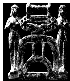
شکل ۱. (راست): پیکره الهه‌هایی که با دو دست سینه خود را گرفته‌اند، از لرستان [ص ۱۷، ۷۶]