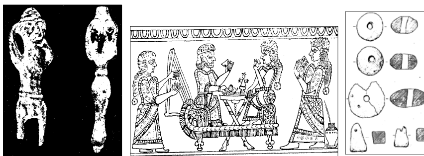
شکل ۴. (راست): سردوک‌ها، حلقه‌های بافندگی و وزنه‌های دستگاه بافندگی از تپه نوشیجان [ص. ۲۰، ۲۵-۲۶]

شواهد موجود، نشان از فعالیت زنان خنیاگر و موسیقی‌دان در دوره ماد دارد. در صحنه‌ای که روی ظرفی از لرستان نقش شده، یکی از زنان در حال نواختن چنگ دیده می‌شود و زن دیگر جفجغه‌ای (سیستروم) در دست دارد (شکل ۵). کالیکان معتقد است، از آنجا که ظرف مذکور در ناحیه‌ای نزدیک به هسته اصلی سلطنت مادها ساخته شده، ممکن است اشکال برجسته روی آن نیز یک شاهزاده کوچک و محلی از اوایل دوره ماد را نشان دهد [نک: ص. ۱۴، ۲۳]. تصویر، دو مجسمه مؤنث و کوچک برنزی از لرستان را نشان می‌دهد که حالتی شبیه به گریه‌وزاری دارند. گیرشمن عقیده دارد که احتمالاً در این زمان زن‌هایی را اجیر می‌کردند تا هنگام مراسم تدفین گریه‌وزاری کنند و موهای خود را بکنند [ص. ۱۷، ۵۷]. اثبات درستی این نظر دشوار است، اما نوعی شیون، که با کندن موی سر و خراشیدن صورت همراه است، هنوز هم در میان زنان روستایی و کوچ‌نشین مناطق لرستان و کرمانشاه رایج است.