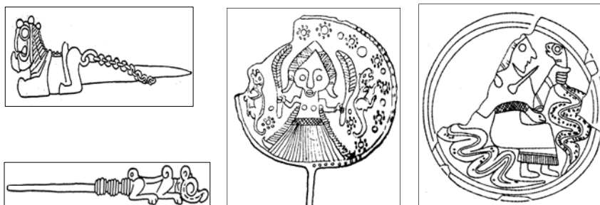
شکل ۱۳. (راست): سر یک سنجاق مفرغی از سرخ دم لرستان با نقش سنجاق روی لباس الهه [۱۹]. ش ۱۱]