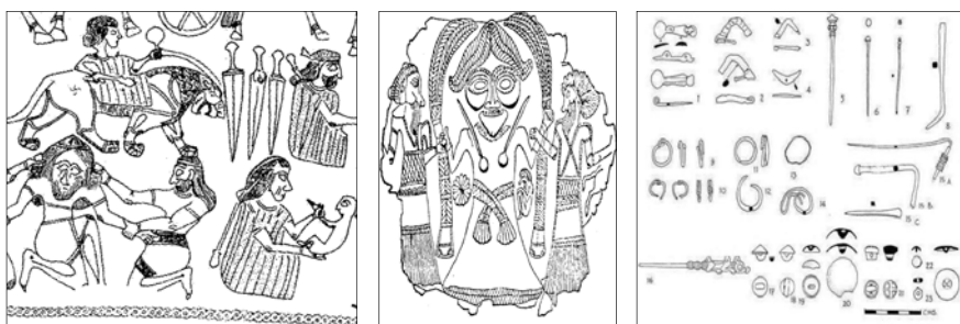
شکل ۱۰. (راست): زیورآلات برنزی از طبقه II و III تپه باباجان [ص ۲۸، ۱۴]

سنجاق‌ها و سنجاق‌قفل‌ها (فیبول‌ها) از زیورآلاتی‌اند که تصور می‌شود زن‌ها اصلی‌ترین کاربران آن بوده‌اند. سنجاق‌ها، میله یا درفش‌هایی عمدتاً از جنس مفرغ و آهن بوده‌اند که آن‌ها را روی شانه‌های لباس فرومی‌بردند. در برخی از گورستان‌های منطقه لریستان، گورهایی متعلق به زنان کاوش شده که در آن‌ها سنجاق‌ها درست روی سر اسکلت قرار داشتند و این تصور را ایجاد می‌کند که از آن‌ها برای بستن موی سر استفاده می‌شده است [نک: ۲۹]. در عصر آهن، این نوع سنجاق در سرتاسر غرب ایران رواج داشت و به تعداد زیاد از محوطه‌های باستانی این مناطق به‌دست آمده است. به نظر می‌رسد که فنون ساخت چنین سنجاق‌هایی در این زمان در لریستان، کردستان، آذربایجان، همچنین دره‌های البرز در جنوب دریای خزر، یعنی بخش اعظم منطقه ماد، گسترش داشته است [ص ۱۴، ۱۶].