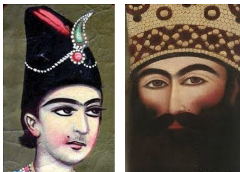
تصویر ۳۵. بخشی از تصویر فتحعلی‌شاه، مهر علی [۴۲]

اما حتی پس از محرز شدن وجود خال، آن هم نه روی چانه، بلکه بر بالای لب یک ابهام باقی می‌ماند، آن هم محل قرارگیری خال در دو نقاشی دوران نوجوانی و در نقاشی‌های زمان پادشاهی اوست. این خال در نقاشی نوجوانی بالای لب و نزدیک به گونه راست کشیده شده است. درحالی‌که نقاشی‌های دوران پادشاهی او را با خالی روی گونه چپ نشان می‌دهند (تصویر ۳۵). همین منطبق نبودن ما را با دو سؤال مواجه می‌کند. اول اینکه مکان واقعی خال کجا بوده است؟ در نتیجه این قطعی نبودن، حتی احتمال بودن این خال روی چانه نیز می‌رود، زیرا اگر بالای لب بود، برای دیده شدن در نقاشی‌هایی که ریش مانع از جلوه کردن آن می‌شد، کافی بود در همان سمت راست صورت کمی جابه‌جا شود نه اینکه در قسمت چپ صورت نقاشی شود. این موضوع تأکید آرایش گونه بر وجود خال مذکور از جانب نقاش با اعمال نظر شخص شاه را تقویت می‌کند، زیرا نقاشان کمتر سلیقه خودشان را در آثار دخیل می‌کردند و بیشتر از آنکه تشخیص فردی هنرمند نقش ایفا کند، سلیقه زیباشناختی رایج و شخص شاه حرف نخست را می‌زد [۳۱، ص ۵۸؛ ۳۴].