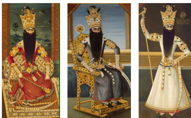
تصویر ۸. راست، فتحعلی‌شاه، ۱۲۲۴ه/۱۸۰۹م، مهرعلی، موزه ارمیتاژ [۳۸، ص ۶] تصویر ۹. وسط، فتحعلی‌شاه، ۱۲۲۱ه/۱۸۰۶م، مهرعلی، لوور [همان] تصویر ۱۰. چپ، فتحعلی‌شاه، ۱۲۲۹ق/۱۸۱۴م، مهرعلی، ارمیتاژ [همان]

در بعضی موارد، انتهای سرآستین‌ها به یک بخش تاج‌مانند ختم می‌شود (تصویرهای ۱۱ - ۱۳). لباس زنان حرمسرا نیز آستین‌هایی دارند که مانند لباس شاه مرواریددوزی‌اند و اشکال هندسی در قسمت میانی قرار گرفته است. بعضی از آنها نیز قسمت‌های تاجی‌شکل دارند (تصویرهای ۱۴ - ۱۶).