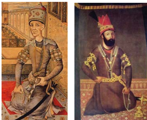
تصویر ۳. راست، نادرشاه، محمدرضا هندی، اصفهان، ۱۷۴۰م [ص ۲۸، ۵] تصویر ۴. چپ، آقامحمدخان قاجار، بخشی از نقاشی، میرزا بابا [۳۹]