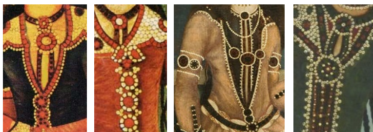
تصویر ۲۶. از راست، اول، بخشی از نقاشی «زن رقصنده»، بنیاد هنر اسلامی دریس دوک [۴۳] تصویر ۲۷. از راست، دوم، بخشی از «زن تارنواز»، ۱۸۰۰-۱۸۳۰م، موزه ویکتوریا و آلبرت [۴۱] تصویر ۲۸. از راست، سوم، بخشی از تصویر ۲۰، بانوی حرم، دوره فتحعلی‌شاه [۳۵] تصویر ۲۹. از راست، چهارم، بخشی از تصویر ۲۱، بانوی حرم، دوره فتحعلی‌شاه [۳۵]

دلایل ما برای اثبات اینکه نوع تزئینات کمربند یک سلیقه زنانه است با بررسی سایر قسمت‌های لباس زنان مستحکم‌تر خواهد شد. توجه به یقه لباس بانوان حرم از یک تزئین شبیه به کمربند خبر می‌دهد. در قریب به اتفاق لباس آن‌ها همان حلقه کمربند دیده می‌شود. این حلقه به‌منزله موتیفی مورد علاقه در بخش‌های دیگر لباس هم استفاده شده است و گویی زنان در استفاده از آن آگاهانه اصرار می‌ورزیدند (تصویرهای ۲۶-۲۹). حتی در گل‌سرها نیز همین موتیف تزئینی تکرار می‌شود (تصویرهای ۳۰-۳۲).