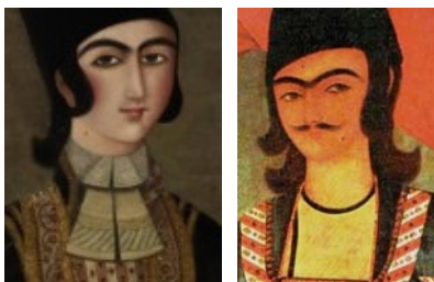
تصویر ۳۳. راست، بخشی از نقاشی تصویر ۱۸، «شاهزاده با تفنگ»، دوره فتحعلی شاه، محمدحسن [۳۵] تصویر ۳۴. چپ، بخشی از نقاشی تصویر ۱۷، «شاه و شاهزاده»، ۱۲۳۵ق، مهرعلی [۴۰]

پیگیری بحث آرایش به منزله دومین فرضیه نیز امکانات تازه‌ای را در موضوع تأثیرپذیری فتحعلی شاه از زنان فراهم می‌کند. خال صورت یکی از زینت‌های زنان محسوب می‌شد که آن را بالای لب یا گونه قرار می‌دادند. نقاشان نیز این میل زنانه را در تابلوهایی که از زنان حرم تهیه می‌کردند در نظر می‌گرفتند. با مراجعه به پیکرنگاری فتحعلی شاه متوجه وجود چنین خالی بر بالای لب او هم می‌شویم. برخی معتقدند که او خود شخصاً این خال را داشته است، اما مکان قرارگیری آن را در قسمت چانه دانسته‌اند [۲۳]. اما ما نقاشی‌ای در دست داریم که فتحعلی شاه را در دوران نوجوانی با یک خال بالای لب نشان می‌دهد (تصویر ۳۶). اگر نقاش جانب واقع‌گرایی را رعایت کرده باشد، در نتیجه باید پذیرفت که فتحعلی شاه حقیقتاً صاحب چنین خالی بوده است که اتفاقاً بر بالای لب او قرار داشته نه در قسمت چانه. پس نمی‌توان مدعی شد که وجود این نقطه سیاه در نقاشی‌های فتحعلی شاه فقط یک آرایش بوده است. محققان معتقدند شاه به علت آنکه وجود ریش مانع از دیده شدن خال مذکور می‌شد، به نقاشان دربار تأکید می‌کرد که آن را روی گونه‌اش قرار بدهند [۲۳، ص ۲۲]. و امروزه یکی از مشخصات خاص نقاشی‌های او، که چهره‌اش را از سایر قاجاریان هم‌شکل جدا می‌کند، همین خال است [۲۴، ص ۱۳۱].