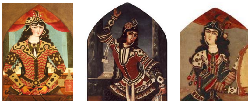
تصویر ۱۴. «زن دف‌نواز»، اوایل سده ۱۳، موزه ویکتوریا، لندن [۴۱] تصویر ۱۵. «زن رقصنده»، سده ۱۳ ق، موزه ویکتوریا، لندن [۴۰] تصویر ۱۶. «زن سنتورزن»، ۱۲۴۵ ق، بنیاد هنر اسلامی دوریس دوک [۴۳]

این نوع سرآستین، از آنجا که در لباس درباریان عمومیت ندارد، مبین نوع پوشاک مدشده در آن دوران نیست (تصویرهای ۱۷-۱۹).