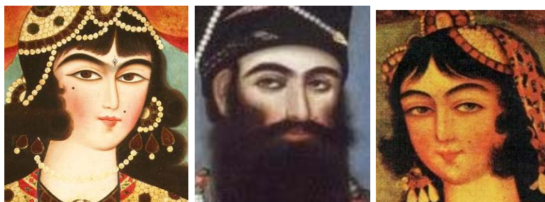
از راست، بخش‌هایی از تصاویر ۲۱، ۷، ۱۶

پیگیری بحث آرایش به منزله دومین فرضیه نیز امکانات تازه‌ای را در موضوع تأثیرپذیری فتحعلی شاه از زنان فراهم می‌کند. خال صورت یکی از زینت‌های زنان محسوب می‌شد که آن را بالای لب یا گونه قرار می‌دادند. نقاشان نیز این میل زنانه را در تابلوهایی که از زنان حرم تهیه می‌کردند در نظر می‌گرفتند. با مراجعه به پیکرنگاری فتحعلی شاه متوجه وجود چنین خالی بر بالای لب او هم می‌شویم. برخی معتقدند که او خود شخصاً این خال را داشته است، اما مکان قرارگیری آن را در قسمت چانه دانسته‌اند [۲۳]. اما ما نقاشی‌ای در دست داریم که فتحعلی شاه را در دوران نوجوانی با یک خال بالای لب نشان می‌دهد (تصویر ۳۶). اگر نقاش جانب واقع‌گرایی را رعایت کرده باشد، در نتیجه باید پذیرفت که فتحعلی شاه حقیقتاً صاحب چنین خالی بوده است که اتفاقاً بر بالای لب او قرار داشته نه در قسمت چانه. پس نمی‌توان مدعی شد که وجود این نقطه سیاه در نقاشی‌های فتحعلی شاه فقط یک آرایش بوده است. محققان معتقدند شاه به علت آنکه وجود ریش مانع از دیده شدن خال مذکور می‌شد، به نقاشان دربار تأکید می‌کرد که آن را روی گونه‌اش قرار بدهند [۲۳، ص ۲۲]. و امروزه یکی از مشخصات خاص نقاشی‌های او، که چهره‌اش را از سایر قاجاریان هم‌شکل جدا می‌کند، همین خال است [۲۴، ص ۱۳۱].