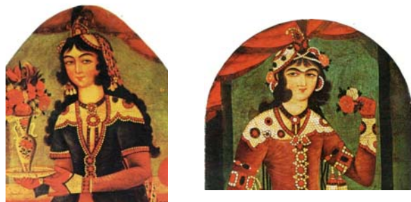
تصویر ۲۰. بانوی حرم، دوره فتحعلی‌شاه [۳۵] تصویر ۲۱. بانوی حرم، دوره فتحعلی‌شاه [۳۵]

این در حالی است که بیشتر تصاویر مرتبط به زنان تزئینات سرآستین دارند (تصویر ۲۰). حتی آن گروهی هم که جواهردوزی عریض ندارند، باز هم از بخش‌های مزین با مروارید و امثال آن تشکیل شده‌اند، که می‌توان نوع ساده جواهردوزی آستین محسوبشان کرد (تصویر ۲۱).