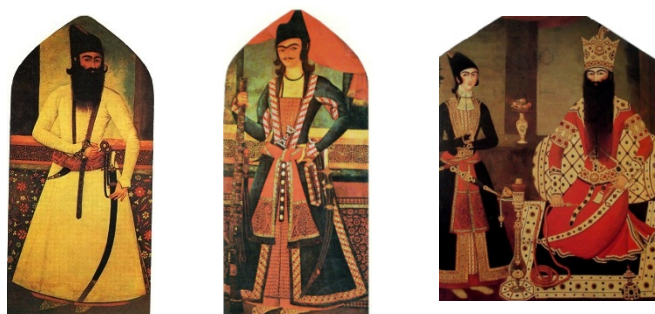
تصویر ۱۷. شاه و شاهزاده، ۱۲۳۵ ق، مهرعلی [۴۰] تصویر ۱۸. شاهزاده با تفنگ، دوره فتحعلی‌شاه، محمدحسن [۳۵] تصویر ۱۹. اشراف زاده، دوره فتحعلی‌شاه [۳۵]

این نوع سرآستین، از آنجا که در لباس درباریان عمومیت ندارد، مبین نوع پوشاک مدشده در آن دوران نیست (تصویرهای ۱۷-۱۹).