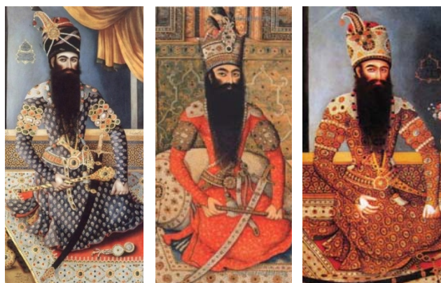
تصویر ۵. راست، فتحعلی‌شاه، ۱۲۱۳ق/۱۷۹۸م، میرزابابا، تهران [۳۸، ص ۵] تصویر ۶. وسط، فتحعلی‌شاه، ۱۲۱۷ق/۱۸۰۲م، میرزابابا [۳۹] تصویر ۷. چپ، فتحعلی‌شاه، ۱۲۱۳ق/۱۷۹۸م، میرزابابا، تهران [۳۱]