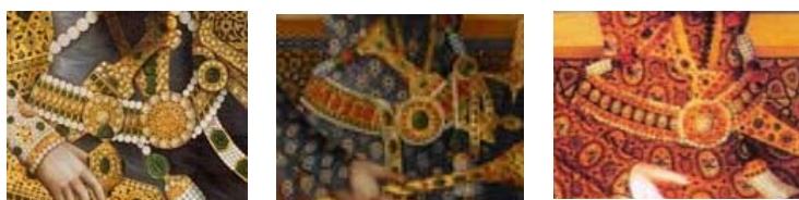
به ترتیب از راست بخش‌هایی از تصاویر ۵، ۷، ۹

کمر بند فتحعلی شاه معمولاً شامل نواری از درّ و گوهر بود که به نقشی مدور در وسط منتهی می‌شد. لبه‌های این نوار را دو ردیف مروارید فراگرفته است. نقش مدور مرکزی نیز شامل لبه‌هایی از مروارید و سنگ گرانبهایی در مرکز می‌شود. مراجعه به لباس حرم‌نشینان مشخص می‌کند که زنان نیز روی لباس‌های خود کمربندهایی می‌بستند. مقایسه کمربندهای زنانه و کمربندهای فتحعلی‌شاه از یکسانی عجیبی بین این دو گروه خبر می‌دهد. حتی برای آن دسته از کمربندهایی که زیورآلاتی آویزان بر پایین آن‌ها نصب شده نیز نمونه‌های مشابه در لباس زنان قابل شناسایی است (تصویرهای ۲۴ و ۲۵).