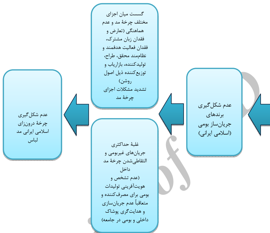
شکل ۲. عوامل و پیامدهای موجود عدم شکل‌گیری برندهای جریان‌ساز مد لباس بومی

چنانچه مشاهده می‌شود، مشکلات یا عوامل عدم شکل‌گیری برندهای جریان‌ساز بومی و به دنبال آن نابسامانی در چرخه مد لباس داخل و عدم شکل‌گیری چرخه مد بومی، دو سطح زیربنایی (عوامل ریشه‌ای و مبنایی) و روبنایی را دربرمی‌گیرد. درواقع، مشکلات موجود در هر یک از مراحل چرخه مد خود در مشکلات ساختاری زیربنایی ریشه دارد. مشکلات بنیادین ساختاری را می‌توان ذیل سه ساختار اصلی معرفتی، ساختار فرهنگی اجتماعی و ساختار اقتصادی سیاسی به صورت یادشده مورد توجه قرار داد که بالطبع بر یکدیگر تأثیر و تأثر متقابل دارند. درواقع ساختارهای اجتماعی فرهنگی و اقتصادی سیاسی به ساختار معرفتی مرتبط‌اند و بر آن تأثیر می‌گذارند و از آن تأثیر می‌گیرند. ۱ پس زمانی که از فقدان ظرفیت‌های برندسازی