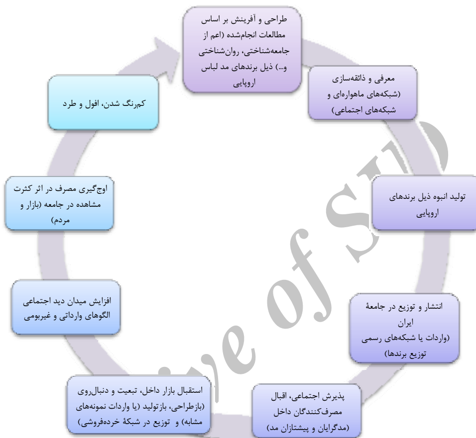
شکل ۳. وضعیت موجود چرخه مد لباس در جامعه ایران

نکته شایان توجه در نسبت و تقدم و تأخر مراحل یادشده آن است که این مراحل به صورت پیوسته، در هم آمیخته و بعضاً موازی اتفاق می‌افتد و به هیچ‌وجه قابل تفکیک از یکدیگر نیستند. در پایان، در جمع‌بندی وضعیت چرخه مد ایران بر مبنای نظریه‌های ارائه‌شده، به نظر می‌رسد نظریه انتخاب جمعی هربرت بلومر در مقابل نظریه بالا به پایین جورج زیمل در توضیح چرخه مد لباس در جامعه ایران تا حدی گویاتر و مناسب‌تر باشد. اینکه مکانیسم مد نه در پاسخ به نیاز تمایز طبقاتی و تقلید طبقاتی، بلکه در پاسخ به میل «در مد بودن»، میل به اظهار سلیقه‌های جدید در یک جهان متغیر پدیدار می‌شود. تأکید صورت‌گرفته بر نقش فضای اجتماعی و اطرافیان و مقبولیت اجتماعی یک سبک و پرهیز از اینکه در نگاه دیگران «قدیمی