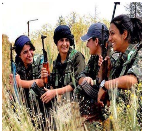
تصویر ۱. گریلاهای زن مدافع خلق در کوبانی