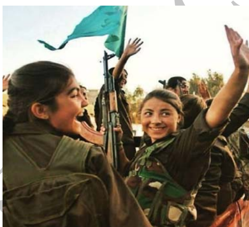
تصویر ۲. گریلاهای زن مدافع خلق در کوبانی

در اینجا با تغییری دیگر مواجهیم. آنچه زنان کرد از جنگ، به‌ویژه جنگ با داعش، درک می‌کنند بیشتر فرمی از مقاومت است تا جنگ. مقاومت فرمی از مبارزه برای زندگی است، اما جنگ ممکن است برای حمله به دیگری صورت بگیرد. این مسئله را می‌توان در نام یکی از صفحه‌های عمومی در فیس‌بوک در زمینه مبارزه زنان کوبانی مشاهده کرد: «مقاومت، زندگی است.» زنان کرد تجربه مقاومت زنانه در کوبانی را به‌منزله تجربه‌ای درک می‌کنند که در آن کنش زنانه به اوج خود می‌رسد. زنان عاملیت خودشان را نشان می‌دهند و مرکزیت مردانه در جنگ و مقاومت را به چالش می‌کشند. یکی از زنان کرد در صفحه فیس‌بوک خویش چنین نوشته است: