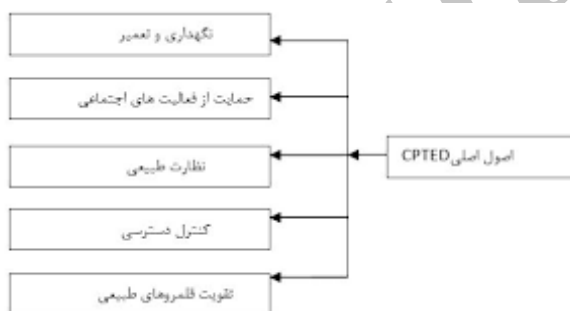
نمودار ۱. مؤلفه‌های مدل پیشگیری از جرم [۱۴]

امکانات و تسهیلات به وجود می‌آورند. در فضاهای مختص بانوان زنان قادر به سهیم بودن تجارب خود باهم هستند و همچنین بر احساس انزوای خود در جامعه غلبه می‌کنند. محیط فیزیکی می‌تواند تأثیرات مستقیمی بر بستر جرم به‌وسیله طرح قلمروها، کاهش یا افزایش دسترسی‌ها، به وسیله تقویت مرزها داشته باشد. یک محیط دارای عرض کمتر نسبت به جرم آسیب‌پذیرتر است، زیرا فعالیت‌ها را محدود می‌کند و برای افراد ارتکاب جرم را آسان‌تر می‌کند. جفری براساس نتایج و محققان قبلی نظریه CPTED را در کتابش در سال ۱۹۷۱ به نام جلوگیری از جرم با استفاده از طراحی محیط ارائه داد [۱۴، ص ۲۱۰-۲۳۰]. جفری در نظریه‌اش بر نقش محیط فیزیکی در ایجاد تجربیات هنجار و ناهنجار مختلفی که ظرفیت تغییر رفتار را دارد تأکید می‌کند.