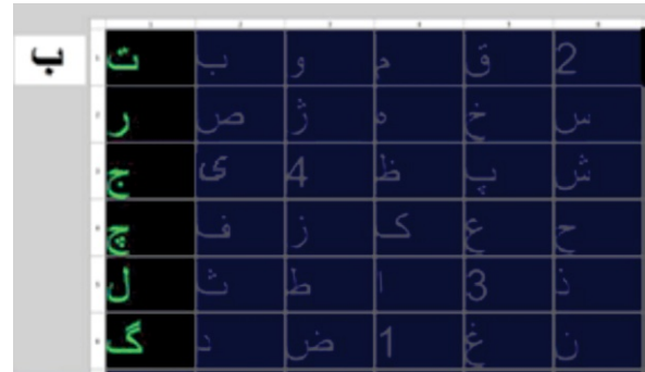
(شکل-۱): ماتریس تحریک ردیف و یا ستون به‌ازای نمایش

در این آزمایش‌ها یک جدول ۶×۶ متشکل از ۳۲ حرف الفبای فارسی + اعداد تک‌رقمی یک تا چهار به فرد داوطلب نشان داده شد. مجموعه‌ای از نویسه‌ها توسط آزمایش‌گر پیش از شروع آزمایش انتخاب شده و در هر بار تکرار آزمایش یکی از نویسه‌ها به‌عنوان نویسه هدف انتخاب شده و این نویسه در گوشه سمت راست صفحه‌نمایش، در بالای جدول نشان داده شد.