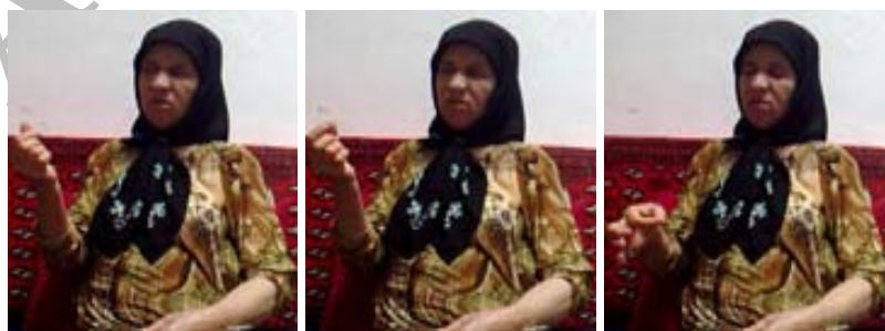
شکل (۲۲) نشانه سکه

(الف) ابزار فضا جهت نمایش شکل مفهوم: در این شیوه فرد با فضایی که به توسط دست (ها) ی خود ایجاد می کند، شکل مفهوم را به تصویر می کشد. برای نمونه در نشانه سکه (شکل ۲۲) انگشتان سیبیه و شصت در کنار یکدیگر فضایی مدور را ایجاد کرده اند که در حقیقت شکل مدور سکه را نمایش می دهد.