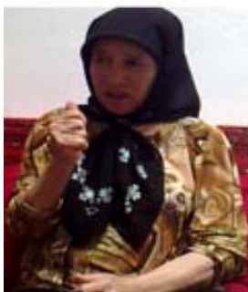
شکل (۲) نشانه تنگ

(پ) ابزار شکل جهت نمایش اندازه‌ی مفهوم: برخی مواقع برای شناساندن یک مفهوم به اندازه آن می‌توان اشاره کرد. در واقع نمایش اندازه یک مفهوم خود ابزاری است که در به تصویر کشیدن آن مفهوم می‌تواند بسیار مفید باشد. برای نمونه در نشانه جارودستی (شکل ۳) کف دست چپ همزمان با نمایش شکل جارودستی، اندازه تقریبی آن را نیز به تصویر می‌کشد.