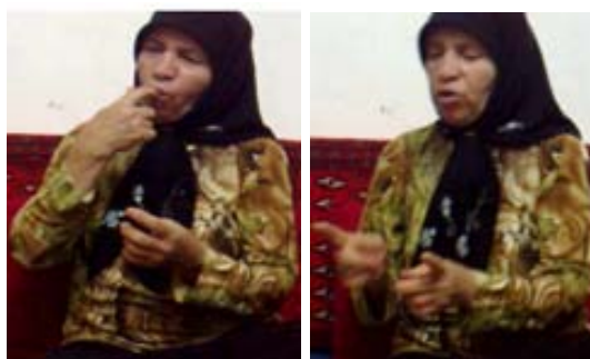
(الف) نشانه شیشه شیر بچه

(ب) ابزار فضا جهت نمایش اندازه مفهوم: این ابزار زمانی به کار می‌رود که اندازه مفهوم از طریق ایجاد فضایی میان دست‌ها (و یا انگشتان) نمایش داده می‌شود. برای نمونه در نشانه مرکب شیشه شیر بچه (شکل ۲۳ الف) که از دو بخش شیشه شیر + مکیدن تشکیل شده است، برای نمایش شیشه شیر از طریق ایجاد فضا میان دو انگشت سبابه، به اندازه آن اشاره شده است. در برخی نشانه‌ها نیز اندازه مفهوم از طریق ایجاد فضا بین دست و شئی دیگر نمایش داده می‌شود. برای نمونه در نشانه‌های بلند و کوتاه (شکل ۲۳ ب و پ) میان یک دست و زمین فضایی ایجاد می‌شود که اندازه مفهوم را نمایش می‌دهد.