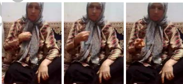
شکل (۱۱) نشانه دکمه

(ج) ابزار حرکت جهت نمایش عدد: در برخی از نشانه‌ها حرکت دست حرکت مفهوم یا اعضای دست را نمایش نمی‌دهد، بلکه به منظور نمایش عدد به کار رفته است. برای نمونه در نشانه دکمه (شکل ۱۱) حرکت مکرر دست در راستای سینه به سمت پایین به وجود دکمه‌های متعدد در پیراهن اشاره دارد.