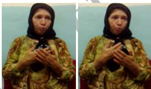
شکل (۱۳) نشانه دعوا کردن

(ح) ابزار حرکت جهت نمایش کیفیت مفهوم: در برخی نشانه‌ها حرکت دست‌ها برای نمایش کیفیت مفهوم به کار می‌رود. برای نمونه در نشانه دعوا کردن (شکل ۱۳) حرکت مستقیم دست راست به سمت پایین و در جهت دست چپ کیفیت وجود برخورد میان طرفین دعوا را به تصویر می‌کشد.