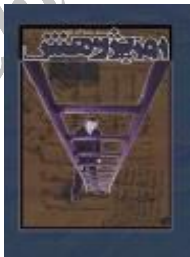
تصویر 5) استعاره کلامی-تصویری پژوهش نردبان (ترقی) است

ج: تأثیر کاربردشناختی این پوستر را می‌توان گرامیداشت حضرت محمد (ص) دانست. همچنین، ترکیب رنگها نیز بیانی استعاری یافته است. در این پوستر، رنگ زرد نشانه حوزه مبدأ نور، و رنگ سبز نماد اسلام است. این نمادهای رنگی نقش موثری در انتقال مفاهیم دینی اسلامی بازی می‌کنند. اکنون به بررسی آخرین پوستر مورد نظر این مقاله توجه کنید.