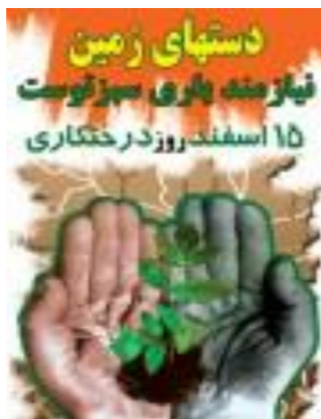
تصویر 1) استعاره کلامی - تصویری (کره زمین (دست) انسان است

الف: استعاره مفهومی (کره زمین (دست) انسان است. حوزه مفهومی دست به صورت کلامی و تصویری و حوزه مفهومی زمین تنها به صورت کلامی در عبارت دستهای زمین نمایش داده شده است. در استعاره تصویری و کلامی، حوزه مفهومی (دست) انسان، مبدأ و زمین مقصد است. هر دو این حوزه‌ها ملموس و غیر ذهنی‌اند. این استعاره در تصویر با حاشیه سبزی که برای دستان کشیده شده است تقویت می‌شود. قرار دادن رنگ سبز دست در پیش‌زمینه و قهوه‌ای در پس‌زمینه تصویر، نماد تضاد حیات و سرسبزی با خشکی است. این دو حوزه مفهومی قابلیت معکوس‌شدگی را ندارند. در واقع، در زیرساخت استعاره فوق، استعاره وجودی جاندارپنداری یا تشخیص وجود دارد. از جمله ترفندهای شناختی که بویژه در ادبیات کاربرد دارد جاندارپنداری عناصر بی‌جان از راه نگاشت مشخصات انسانی بر آنهاست. استفاده از عبارت استعاری دستهای زمین همین کارکرد خلاقانه و ادبی را در پوستر ایفا می‌کند. همچنان که مفهوم نیاز با شکل ساختاری قنوت در نماز به تصویر کشیده شده است.