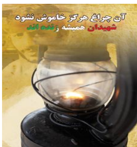
تصویر 3) استعاره کلامی- تصویری شهید چراغ (همیشه روشن) است

پوستر سوم حاوی استعاره کلامی- تصویری شهید چراغ (همیشه روشن) است می‌باشد که به شرح مختصری از آن می‌پردازیم.