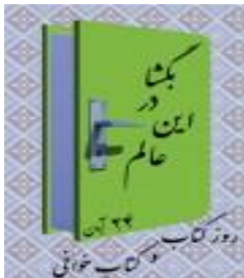
تصویر 2) استعاره کلامی - تصویری کتاب در خانه جهان است

اقتباس از: http://haftehco.ir/wp-content/uploads/00032.jpg