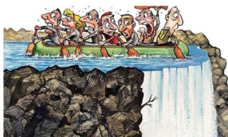
شکل ۱- زمان برای تصمیم‌گیری

گفتاری و فرایند های ذهنی و ت) رخدادها ۱ (کرس و ون‌لیوون، ۲۰۰۶: ۵۹). شکل (۱) نمونه‌ای از فرایند کنشی را نشان می‌دهد می‌دهد که «در آن هفت نفر در قایقی نشسته‌اند و پشت سر آنها آبشاری خطرناک قرار دارد و آنها سعی می‌کنند با حداکثر توان برخلاف جهت آبشار پارو بزنند. چهار نفر آنها با امیدواری پارو می‌زنند و گویی مطمئن‌اند که از آبشار خلاص خواهند شد؛ اما سه نفر دیگر به نظر می‌رسد عصبی‌تر و نگران‌ترند» (ینگ و ژنگ، ۲۰۱۴: ۲۵۶۶). در تصویر مذکور، شش نفر کنش‌گرند. پاروی آنها مانند بردار عمل می‌کند که خطوطی مورب با جریان رودخانه (هدف) می‌سازد. «این فرایند کنشی، انجام‌شدنی است. علاوه بر آن، فرایند کنشی دیگری نیز مطرح است که با آبشاری بیان می‌شود که به پایین می‌ریزد. فرایند مذکور، انجام‌شدنی است؛ به عبارت دیگر، افراد یا اشیائی در آن دخالت ندارند و هدفی نیز نیست» (ینگ و ژنگ، ۲۰۱۴: ۲۵۶۶). متن زبانی شکل (۱) نیز از شکست استراتژی اروپایی صحبت می‌کند و بیان می‌کند «کشورهای اروپایی لازم است تمهیداتی بیشتر بیندیشند تا از بحران مالی خلاص شوند. هفت نفر در واقع هفت کشور اروپایی پرتغال، بلژیک، اسپانیا، یونان، ایرلند، ایتالیا و آلمان‌اند که هنوز فرصت دارند با تلاش بیشتر از بحران خلاصی یابند و آبشار نیز همان بحران مالی است» (ینگ و ژنگ، ۲۰۱۴: ۲۵۶۶). اگر این کشورها تصمیمات فوری و جدی نگیرند، از بین خواهند رفت.