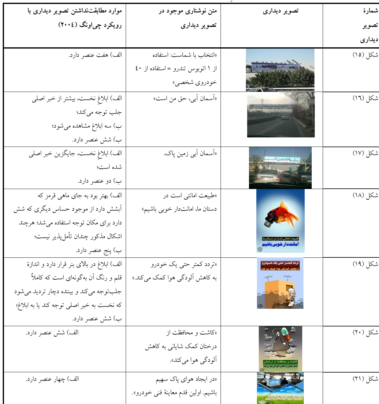
جدول ۲- خلاصه تحلیل مابقی تصویرهای دیداری مربوط به آلودگی هوا

شده است (جدول (۲)، شکل (۱۶)). در این مورد نیز علاوه بر تعدد ابلاغ‌ها، شاید یکنواخت بودن رنگ قلم باعث خسته شدن بیننده شود و خوانش تصویر دیداری را نصفه‌کاره رها کند. گاهی ابلاغ در بالای بنر قرار داشت و اندازه قلم و رنگ آن به گونه‌ای بود که کاملاً جلب توجه می‌کرد و بیننده دچار تردید می‌شد که نخست، به خبر اصلی توجه کند یا به ابلاغ (شکل (۱۹)). در مواردی نیز بخش‌هایی از خبر اصلی با یکدیگر همخوانی نداشتند (جدول (۲)، شکل (۷))؛ یعنی به جای آنکه در توضیح تکمیلی هم باشند، اطلاعات غیرمرتبط ارائه می‌دادند. یافته‌های اخیر نیز در راستای رویکرد چی‌اونگ نیست و لازم است تغییرات لازم طبق رویکرد مذکور اعمال شود تا درک آگهی برای بیننده سهل‌تر باشد.