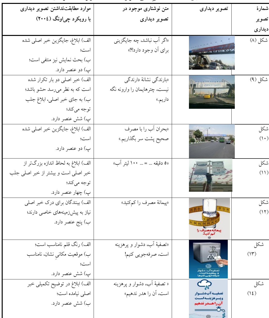
جدول ۱- خلاصه تحلیل مابقی تصویرهای دیداری مربوط به کمبود آب

که ابلاغ جایگزین خبر اصلی شده بود (جدول (۱)، شکل (۸)، و شکل (۱۰)). به‌طور کلی، دو یافته اخیر در راستای رویکرد فوق نیست؛ زیرا ابلاغ نوشته‌ای است که برای توضیح بیشتر درباره خبر اصلی ارائه می‌شود؛ بنابراین ضروری است خبر اصلی برجسته‌تر باشد. موردی مشاهده شد که رنگ قلم برای ابلاغ نامناسب بود (جدول (۱)، شکل (۱۳)) که این یافته نیز در راستای رویکرد فوق نیست و سبب می‌شود ابلاغ درست عمل نکند. موردی دیگر یافت شد که ابلاغ در توضیح تکمیلی خبر اصلی نیامده است (جدول (۱)، شکل (۱۴)). در این حالت، ابلاغ به جای اینکه نقش مکمل داشته باشد، سبب آشفتگی ذهن بیننده خواهد شد. موردی نیز یافت شد که در آن موقعیت مکانی نشان، نامناسب بود (جدول (۱)، شکل (۱۳)) که این یافته نیز در راستای رویکرد فوق نیست. ضرورتی ندارد اندازه و موقعیت قرار گرفتن نشان، جلب توجه کند؛ زیرا اصلی‌ترین عنصر، خبر اصلی است نه نشان. در واقع هدف از نشان، این است که صرفاً آگهی‌دهنده را معرفی کند.