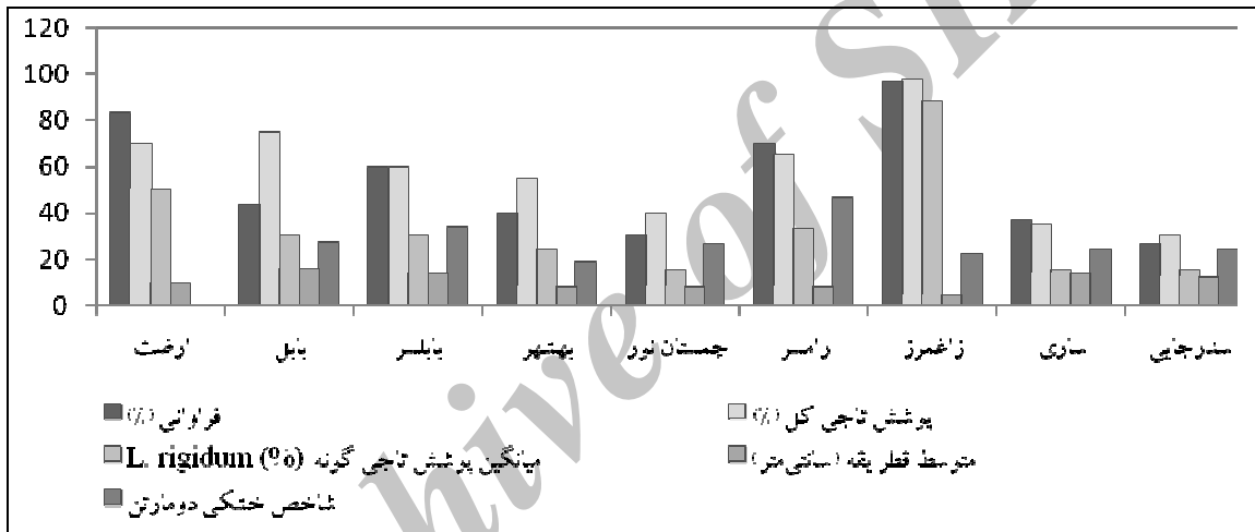
شکل ۲- نمودار بررسی ویژگی‌های کمی پوشش گیاهی L. rigidum در رویشگاه‌های مورد بررسی