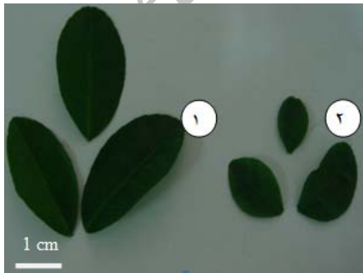
شکل ۲- شکل برگ (۱: گیاه شاهد، ۲: گیاه تیمار شده)

بررسی شکل برگ (شکل ۲) در گیاه لیموترش نشان داد که برگ‌های گیاهان تتراپلوئید از نظر اندازه (جدول ۱) دارای طول و عرض کمتری نسبت به گیاهان دیپلوئید بودند. علاوه بر این، برگ‌های گیاهان تتراپلوئید چین‌خورده و ناصاف بودند. مقایسه سطح برگ (جدول ۱) نشان داد که گیاهان تتراپلوئید به طور معنی‌داری سطح برگ کمتری نسبت به گیاهان دیپلوئید دارند.