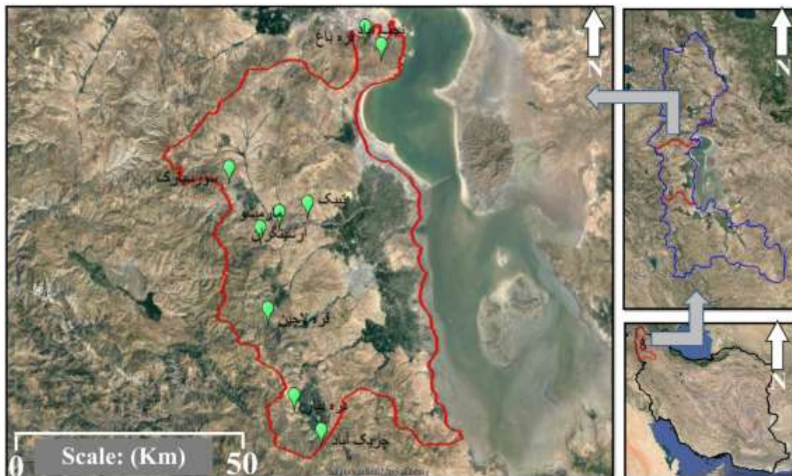
شکل ۱- نقشه پراکنش رویشگاه‌های محل پراکنش E. procera در مراتع کوهستانی ارومیه