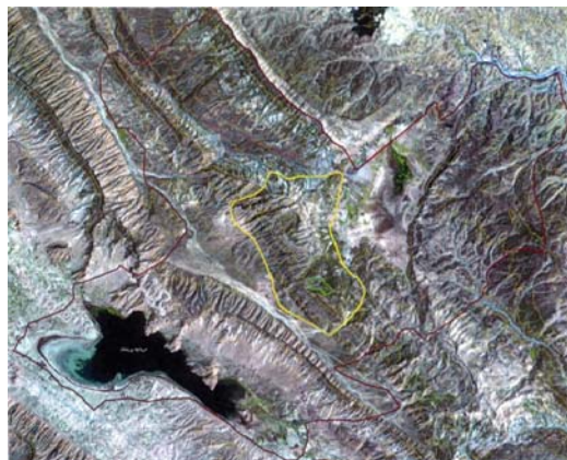
شکل ۲- تصویر هوایی منطقه حفاظت شده ارژن-پریشان

تالاب ارژن دارای ارتفاع ۲۰۱۵ متر از سطح دریاهای آزاد و در فاصله ۶۰ کیلومتری غرب شهر شیراز واقع گردیده است. این تالاب دارای اقلیمی نیمه بیابانی تا نیمه مرطوب است. وجود اختلاف ارتفاع در میان این دو تالاب این منطقه را بسیار حائز اهمیت نموده است، به گونه ای که تنوع زیستی گیاهان در این منطقه بسیار بالاست و بر اساس نوع اقلیم، انواعی از گونه های گیاهی سردسیر و گرمسیر در این ذخیره گاه یافت می شوند. شکل ۲ تصویر هوایی ذخیره گاه ارژن-پریشان را نشان می دهد.