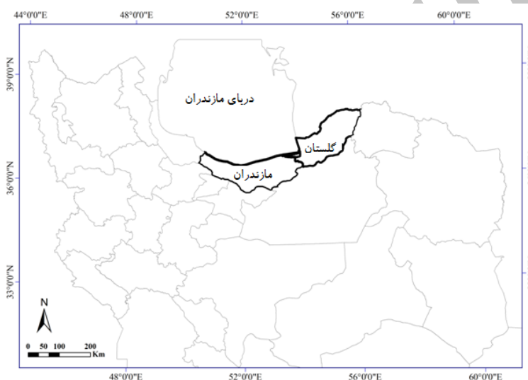
شکل ۱- رویشگاه‌های شمشاد موجود در دو استان گلستان و مازندران مطالعه شده به منظور تهیه بانک اطلاعاتی شمشاد هیرکانی

برداشت شد. مهم‌ترین نکته در روش براون-بلانکه پراکنش مناسب رولوه‌ها (قطعات نمونه) و تعیین صحیح آنها است. برای این منظور ترانسکت‌هایی با فواصل ۴۰۰ متر به عنوان خطوط مبنا در امتداد شیب تغییرات ارتفاع از سطح دریا (عمود بر خطوط منحنی میزان) در نظر گرفته شد و رولوه‌ها با در نظر گرفتن هر گونه تغییر احتمالی در پوشش گیاهی منطقه و با تأکید بر اصل توده معرف (Asti, 1995) در هر رویشگاه پیاده شد. بنابراین، طراحی شبکه