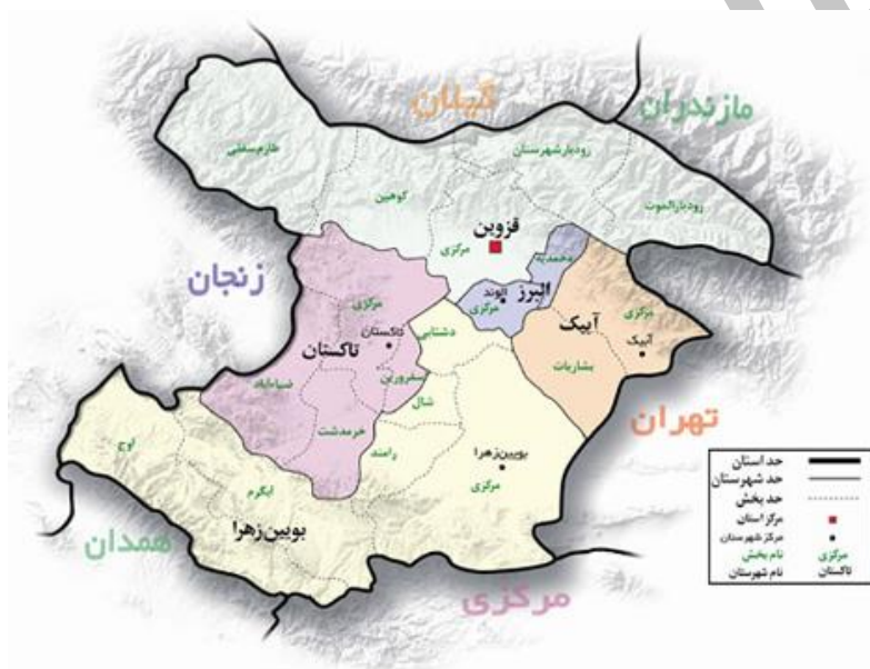
شکل ۱- نقشه استان قزوین و موقعیت شهرستان‌های آن

فلزی سفیدرنگ تکانده شدند و سپس نمونه‌ها با قلم موی آغشته به الکل جمع آوری و به داخل لوله‌های اپندورف محتوی الکل ۷۵ درصد منتقل شدند. روی هر لوله کد مخصوصی درج شد که بیانگر محل و تاریخ جمع آوری، نام گیاه میزبان و نام فرد جمع آوری کننده بود. در نهایت، نمونه‌ها برای تهیه اسلاید میکروسکوپی و شناسایی به آزمایشگاه گیاه پزشکی دانشکده کشاورزی دانشگاه ایلام منتقل شدند.