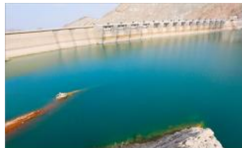
شکل ۳- تصویر سد میناب

۷- آلودگی‌های غیرمترقبه منابع آبی (غیر قابل پیش‌بینی): برای برآورد این پارامتر فاصله هریک از منابع آب را از جاده شهر و مزارع کشاورزی در Google Earth اندازه‌گیری و منابعی که بیشترین فاصله را با این عوارض داشتند به‌عنوان عامل مثبت در نظر گرفته شدند و در تبدیل آن از طریق روش دو قطبی کمترین امتیاز را به خود اختصاص دادند؛ زیرا در صورت نزدیکی زمین‌های کشاورزی به منابع آب این امکان وجود دارد که پسماند آب کشاورزی با کودهای شیمیایی یا فاضلاب‌های شهری وارد منابعی آبی و باعث آلودگی و ایجاد بیماری و کاهش کیفیت آب شود. شکل ۳ تصویر سد میناب را نشان می‌دهد.