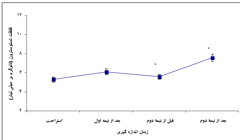
شکل ۲. میانگین و خطای استاندارد غلظت تستوسترون بزاقی در مقاطع مختلف مسابقه فوتبال ( N = 14 ):

* تفاوت نسبت به مقطع اندازه گیری قبل معنی دار است ( P < 0.05 )