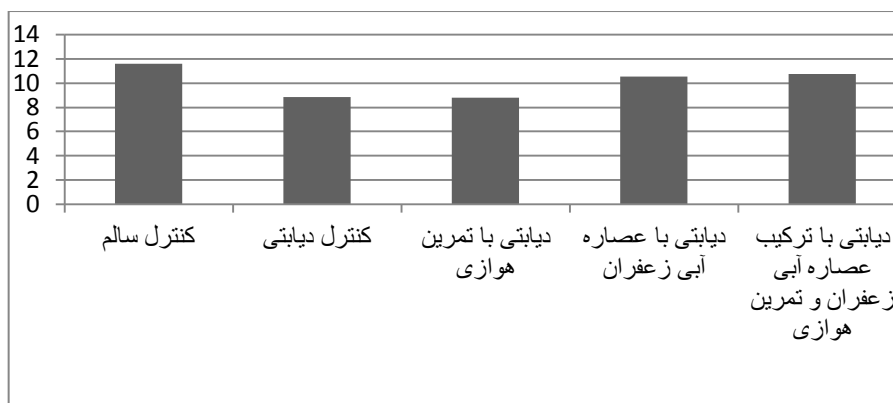
شکل ۲. مقایسه غلظت آنزیم SOD در گروه‌های پنج‌گانه، اطلاعات براساس میانگین و انحراف استاندارد ارائه شده است.

نتایج تحلیل واریانس یکطرفه بر غلظت آنزیم کاتالاز کبدی (SOD) در گروه‌های پنج‌گانه پس از دو هفته تیمار در جدول ۶ ارائه شده است.