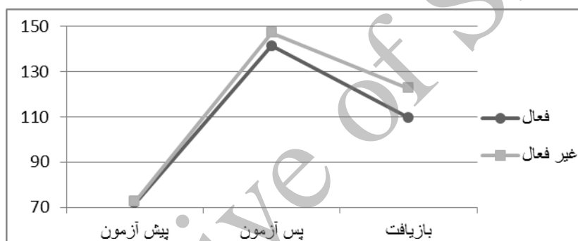
نمودار ۱. میانگین HR دو گروه در پیش آزمون، پس آزمون و باز یافت (ضربه در دقیقه)

همچنین آزمون تحلیل واریانس با اندازه‌گیری مکرر تفاوت معناداری را بین SBP دو گروه به لحاظ تغییرات زمانی ( F=۴/۳۵۳ و P=۰/۰۲ ) نشان داد، یعنی آمادگی بدنی بر پاسخ فشار خون سیستمی به فعالیت و باز یافت مؤثر است. بار دیگر کواریت کردن پیش آزمون ( F=۳/۹۰۷ و P=۰/۰۳ )، پس آزمون ( F=۸/۷۲۹ و P=۰/۰۱ ) و باز یافت ( F=۲/۳۵۷ و P=۰/۱۱۰ ) تفاوت را حاصل از زمان باز یافت نشان داد. آزمون همبستگی پیرسون نیز رابطه معنادار SBP باز یافت را به ترتیب با توجه به ضریب همبستگی و سطح معناداری ذکر شده با HDL ( -۰/۷۰۹ و ۰/۰۰ )، HDL ( ۰/۵۶۴ و ۰/۰۱ )، LDL ( ۰/۶۳۲ و ۰/۰۰۳ ) سطح معناداری ذکر شده با TG ( ۰/۰۰۳ و ۰/۴۸۴ )، BMI ( ۰/۰۳۱ و ۰/۵۱۱ )، BF ( ۰/۰۲۱ و ۰/۶۲۴ )، LDL/HDL ( ۰/۰۰۳ و ۰/۶۲۴ )، TG ( ۰/۰۰۳ و ۰/۴۸۴ )، BMI ( ۰/۰۳۱ و ۰/۵۱۱ )، BF ( ۰/۰۲۱ و ۰/۶۲۴ ) و رکورد