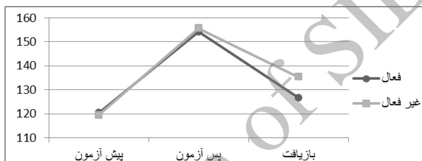
نمودار ۲. میانگین SBP دو گروه در پیش‌آزمون، پس‌آزمون و بازیافت (میلی‌متر جیوه)

افراد (۰/۶۲۵- و ۰/۰۰۳) نشان داد. آزمون تحلیل کواریانس با اندازه‌گیری مکرر با کواریت کردن متغیرهایی که با SBP بازیافت همبستگی معناداری داشتند، نشان داد تفاوت بین افراد فعال و غیرفعال در بازیافت، با کواریت کردن HDL ( F=۰/۵۴۹ و P=۰/۶۱۰ )، LDL ( F=۰/۸۹۴ و P=۰/۴۱۸ )، LDL/HDL ( F=۰/۳۸۶ و P=۰/۹۷۶ ) و TG ( F=۳/۰۸۸ و P=۰/۰۵۹ ) BMI ( F=۰/۰۵۴ و P=۰/۰۵۴ ) و BF ( F=۳/۱۸۳ و P=۰/۰۸۶ ) و رکورد افراد ( F=۲/۶۳۴ و P=۰/۱۹۴ ) به‌عنوان عامل اصلاح از بین رفت. از این رو این عوامل می‌توانند سازوکارهای وجود تفاوت بازیافت فشار خون سیستولی بین افراد فعال و غیرفعال را توضیح دهند.