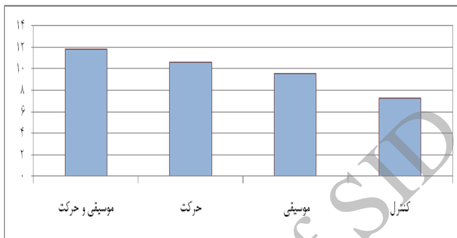
نمودار ۲. نمودار میانگین نمره های معادل سنی حرکات ظریف برای چهار گروه

همان گونه که در جدول ۱ مشاهده می شود، نتایج تحلیل واریانس یکراهه نشان داده است که تفاوت معناداری بین معادل سنی حرکات درشت در میانگین گروه ها وجود دارد.