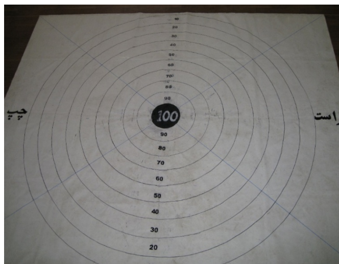
شکل ۱. هدف و جایگاه‌های تعیین شده برای امتیازدهی

در این پژوهش از تکلیفی به نام پرتاب کیسه‌های نخود ۱ استفاده شد. این تکلیف در تحقیقات گذشته برای ارزیابی یادگیری حرکتی در کودکان استفاده شده است (۲۰، ۲۱). از شرکت‌کنندگان درخواست شد درحالی‌که یک چشم‌بند دید آنها را مسدود کرده بود، با دست غیر برتر (چپ) کیسه‌های ۱۰۰ گرمی را به‌سوی یک هدف دایره‌ای که روی زمین پهن شده بود، پرتاب کنند. وسط هدف دایره‌ای ۱۰ سانتی‌متری بود که با رنگ سیاه مشخص شد و داخل آن عدد (امتیاز) ۱۰۰ با رنگ سفید نوشته شد. برای ارزیابی دقت پرتاب دایره‌هایی به مرکز هدف و با شعاع‌های ۲۰، ۳۰، ۴۰ تا ۱۰۰ سانتی‌متر رسم شد (شکل ۱).