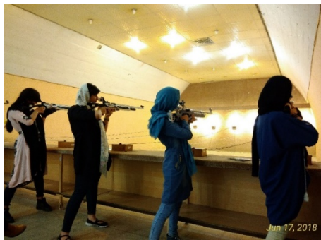
شکل ۲. شرکت‌کنندگان در حال اجرای «شلیک استقامتی بعد از یک دقیقه» در جلسه نهم