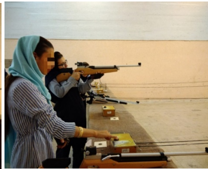
شکل ۱. شرکت‌کنندگان در حال شلیک به سبیل در جلسه دوم