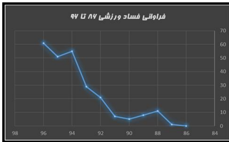
شکل ۲. روند بازتاب فساد ورزشی در رسانه‌های ایران از ۸۶ تا ۹۶

همانگونه که در شکل ۲، مشخص است، در ابتدای مسیر، روند بروز و انتشار فعالیت های مفسدانه، بیانگر شیب و نوسان کندی است که در ادامه به سرعت جای خودش را به شیبی تند و ناگهانی می دهد. این مسئله احتمالاً نشانگر این مطلب است که از یک سو ارتقاء جایگاه، نفوذ و نحوه دسترسی رسانه ها در سالهای اخیر و از سوی دیگر تغییر روح فعالیت‌های ورزشی از مواردی همچون "بازی جوانمردانه" به مواردی مانند فریب کاری و "برنده شدن به هر قیمتی"، باعث شده است روند بروز و انتشار این نوع فعالیت ها با شتاب عجیبی در حال رشد باشد.