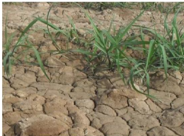
شکل 1- سله بستن سطح خاک در نتیجه کمبود ماده آلی و شکستن خاکدانه‌ها

ماده آلی بین مناطق نیشکر سوخته و سبز توسط بلیر (2000)، دومینی و همکاران (2002) و رازافیمبلو و همکاران (2006) مورد بررسی قرار گرفته است. کشت نیشکر با مالچ بقایا در مقایسه با زمانی که بقایا سوزانده می‌شود، مقدار بیش‌تری کربن آلی به خاک برمی‌گرداند. استوک و داونز (2008) طی پژوهش‌های خود نشان دادند که مقاومت فروروی در خاک‌هایی با صفر تا یک درصد کربن آلی بالاترین مقدار و با افزایش کربن آلی به تدریج کاهش می‌یابد. به نظر می‌رسد خاک‌هایی با ماده آلی کم در برابر تنش‌های ناشی از مرطوب شدن سریع ناپایدارند. کمبود ماده آلی در خاک‌های خشک و نیمه خشک ایران یکی از تنگناهای اصلی در کشاورزی است. آن و همکاران (2010) ماده آلی خاک را مهم‌ترین فاکتور در پایداری خاکدانه‌ها و بهبود ساختمان خاک‌های مناطق خشک و نیمه خشک دانستند. شکستن خاکدانه‌ها در نتیجه کمبود مواد آلی منجر به سله بستن و افزایش مقاومت فروروی سطح خاک می‌شود (شکل 1).