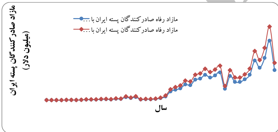
نمودار (۳) - روند تغییرات مآزاد رفاه صادر کنندگان پسته با توجه به نوع سیاست ارزی انتخابی