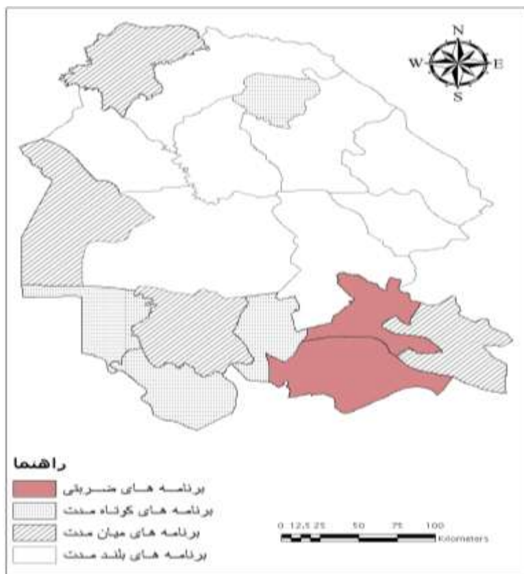
نقشه ۲: نمایش فضایی برنامه‌های پیشنهادی در شهرستان‌های استان خوزستان