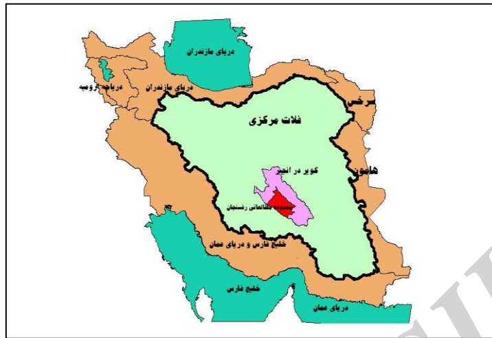
شکل ۱- موقعیت محدوده مطالعاتی رفسنجان در حوزه‌های کویر درانجیر (درجه ۲) و فلات مرکزی (درجه ۱) کشور