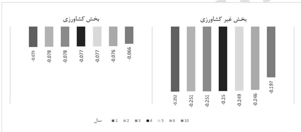
نمودار ۲- تأثیر بخش کشاورزی و غیرکشاورزی بر تغییر نرخ وابستگی به واردات طی هفت سناریو حذف یارانه نان (درصد).