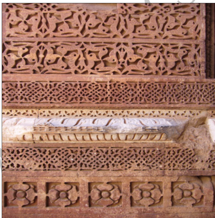
شکل (۲) نمایی از تزئینات مسجد قوت الاسلام