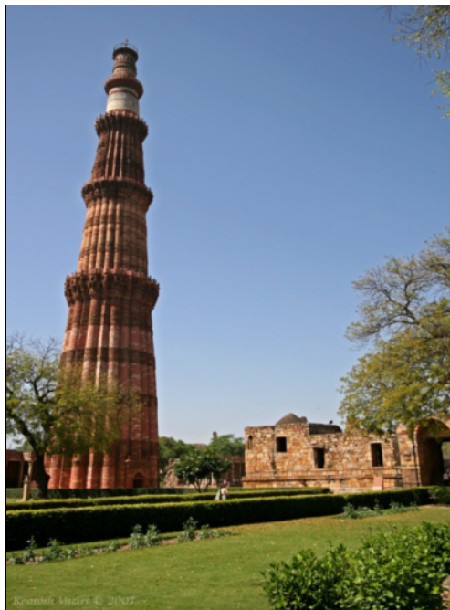
شکل ۳) نمایی از قطب منار دهلی و مسجد قوت الاسلام