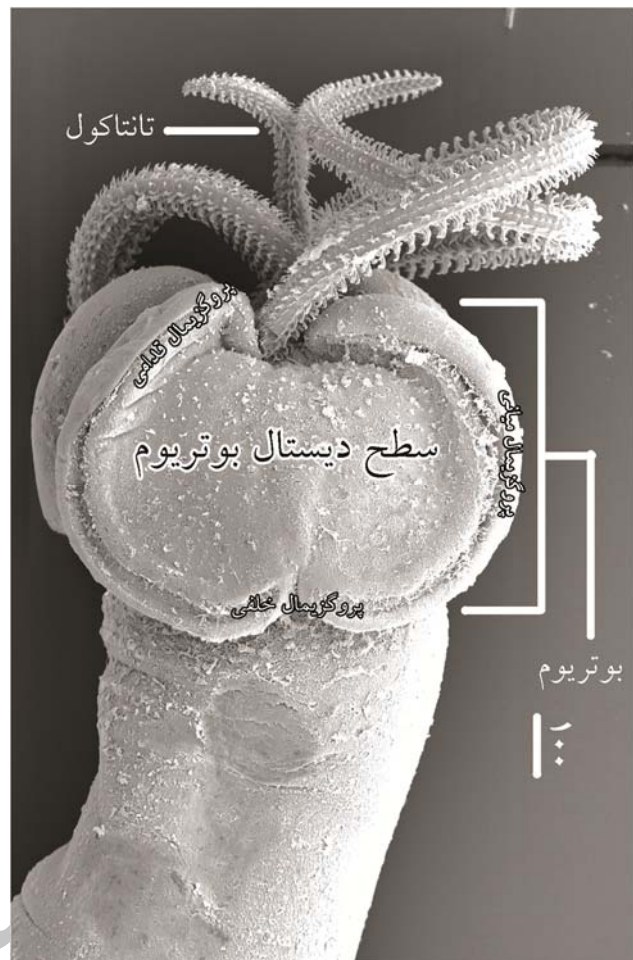
شکل ۱: تصویر میکروسکوپ الکترونی از Callitetrarhynchus gracilis از Pintner, 1931 جهت نشان دادن بخش‌های مختلف راس اسکولکس. مقیاس شکل بر حسب میکرون ارایه شده است (اقتباس از حاصلی، ۱۳۸۹).

شکل ۲: الگوی ریزساختار سطحی در Dollfusiella spinulifera (ریزموها به صورت شماتیک با اندازه‌های غیرواقعی نشان داده شده‌اند). بخش‌های مختلف اسکولکس نیز در این شکل نشان داده شده است: پارس بوتریالیس (pbo)، پارس واژینالیس (pv) و پارس بولبوزا (pb). فلش‌های سیاه و سفید به ترتیب نشان‌دهنده سطوح پروکزیمال و دیستال بوتریوم هستند. شماره‌های داخل شکل انواع ریزموها را نشان می‌دهند: (۱) Acicular filitriches، (۲) Palmate spinitriches با ۶ انگشت، (۳) و (۴) Papilliform filitriches، (۵) Palmate spinitriches با ۷ انگشت، (۶) و (۷) Acicular filitriches.