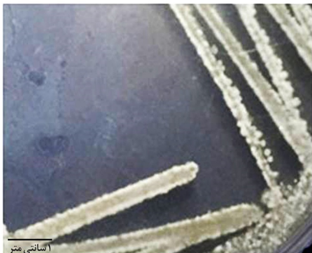
شکل ۱: ریخت‌شناسی نوکاردیوپوسیسیا AHA2 (کلیه ویژگی‌های ظاهری در تصویر قابل تشخیص نیستند. ظاهر سفید گچی که یکی از شاخصه‌های اکتینومیست است که در تصویر می‌توان مشاهده نمود).

تعداد زیادی ترکیبات فعال زیستی تولید شده توسط ریزاندامگان ۲ خشکی وجود دارند ( EL-Masry et al., 2002; Woo et al., 2002). با وجود آن، تلاش‌های فراوانی برای رسیدن به ریزاندامگان دریایی به عنوان منابعی با پتانسیل تولید ترکیبات فعال زیستی در حال انجام است (Lodeiros et al., 2001; Slattery et al., 2001; Liu et al., 2002). جداسازی اکتینومیست‌های نادر و ناشناخته به یکی از بخش‌های مهم در یافتن ترکیبات فعال زیستی تبدیل شده است (Lazzarini et al., 2004; Hayakawa et al., 2000). در این تحقیق ایزوله نوکاردیوپوسیسیا ویژگی‌های ظاهری، تک کلونی سفید گچی، میسلوم زمینی سفید رنگ، میسلوم هوایی سفید، رو و پشت کلونی‌های سفید رنگ از رسوبات ساحل دیلم جداسازی شدند (شکل ۱).